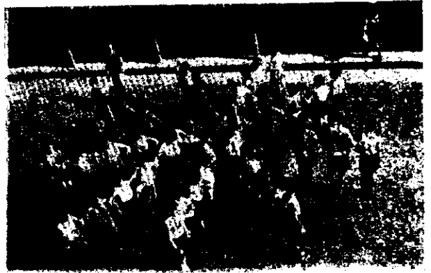
Uma "marcha em estrela"