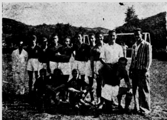
O "team" do América Universitário, campeão de futebol

Viveu Viçosa de 31 a 5, uma semana olímpica de sadia alegria, assistindo em festa um torneio empolgante, em que se disputaram provas e jogos, muitos e vários, demonstrativos do desenvolvimento físico atingido pela mocidade estudantina mineira.