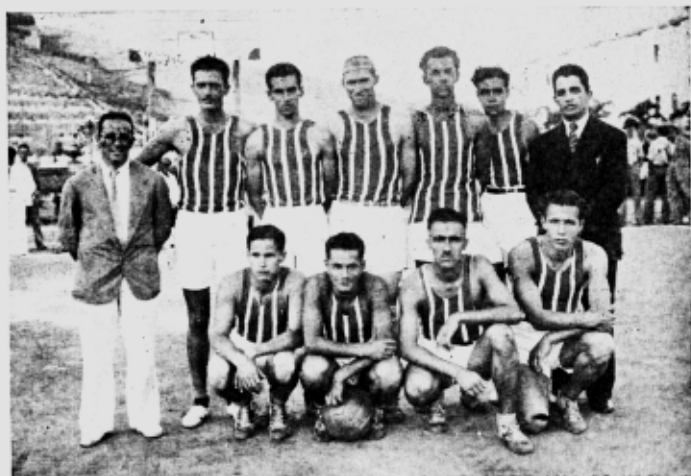
O quadro de "basket-ball" da ESAV que assegurou o campeonato à sua Escola

Partida disputadíssima, pois o Granbery tem um ótimo "five" que obrigou o quadro da ESAV a grande esforço; manteve-se no 1.º tempo imprecisa a contagem por 8 x 8, até que, no 2.º tempo, melhorando a E. S. A. V. sua técnica, vingasse a vitória pela vantagem de 22 x 15.