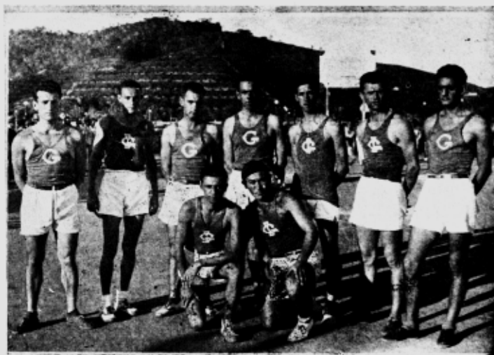
A "équipe" de "volley-ball" do Instituto Gammon, campeã

Equilibrada inicialmente a luta, começou, o América a jogar melhor foot-ball, logrando um entendimento perfeito, do mesmo passo que os rapazes da ESAV, já bem fatigados, pois vinham de preliar com o Granbery, começavam a ceder terreno. A alta contagem de 5 x 2, arrematou o esforço vitorioso do "América".