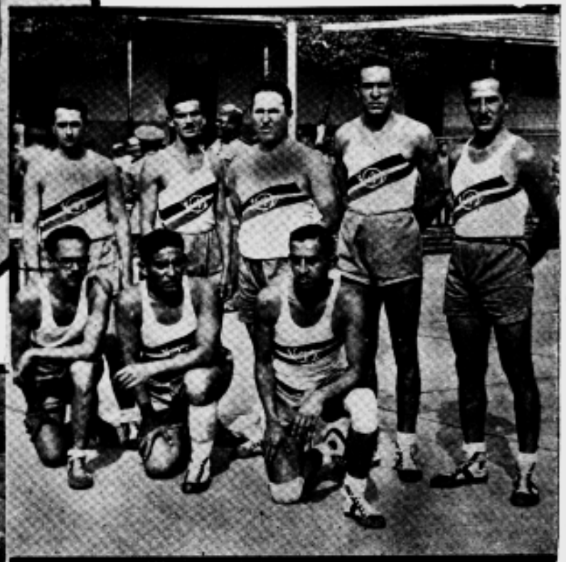
ÉQUIPES DE BASKET BALL E VOLLEY-BALL DE OFICIAIS, BASKET BALL DE PRAÇAS E CONCORRENTES À PROVA DE S. SILVESTRE.