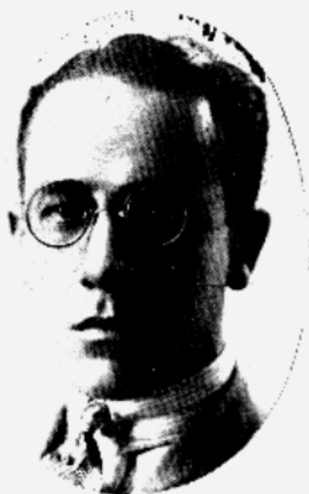
Dr. Fernando de Azevedo Diretor de Educação de S. Paulo