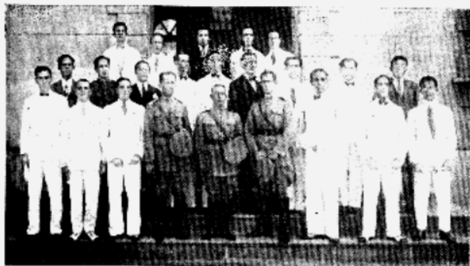
Professores Públicos do Distrito Federal