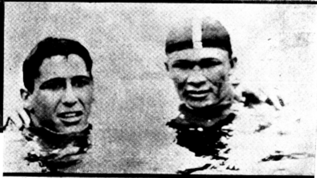
VILLAR E DEFINE PRIMEIROS COLOCADOS NA PROVA DE 1500 METROS