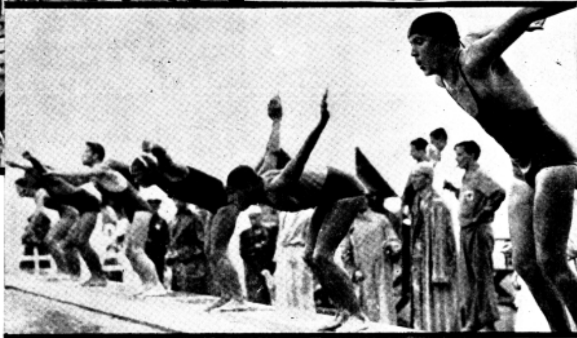
COMPETIÇÃO NÁUTICA ENTRE A F. P. N. E A L. E. M.