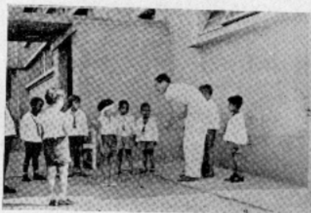
De que lado vem o som?

Mas o educador pôde aperfeiçoar um ouvido incompleto ou imperfeito: é o caso das crianças que não têm bom ouvido para a musica.