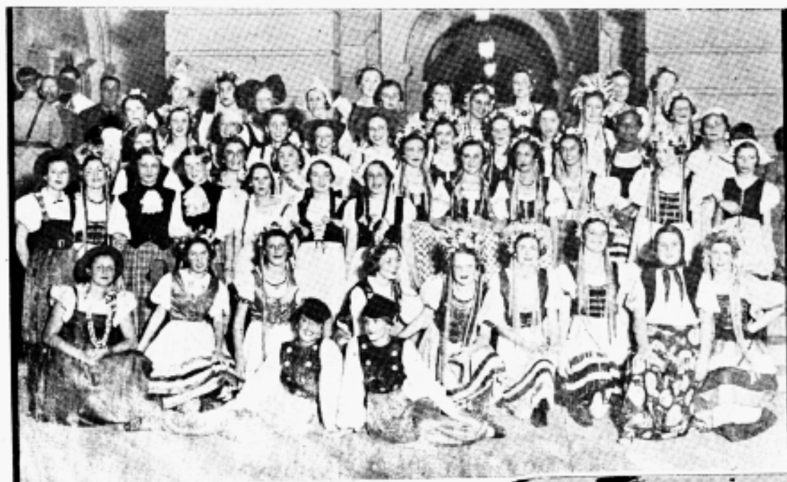
FLAGRANTES DAS DEMONSTRAÇÕES OR- FEÔNICAS E DANÇAS REGIONAIS. MESA QUE PRESIDIU A CERIMÔN- IA DO ENCERRAMENTO