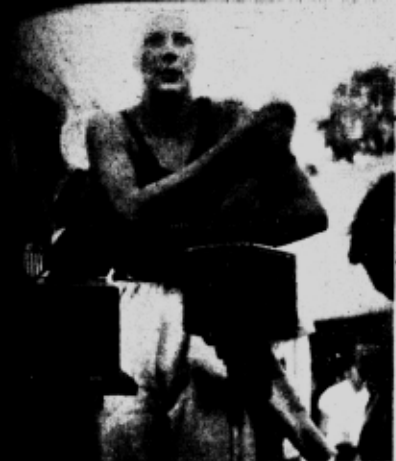
ADISON — 1.º lugar na turrã livre, tempo 4'38"