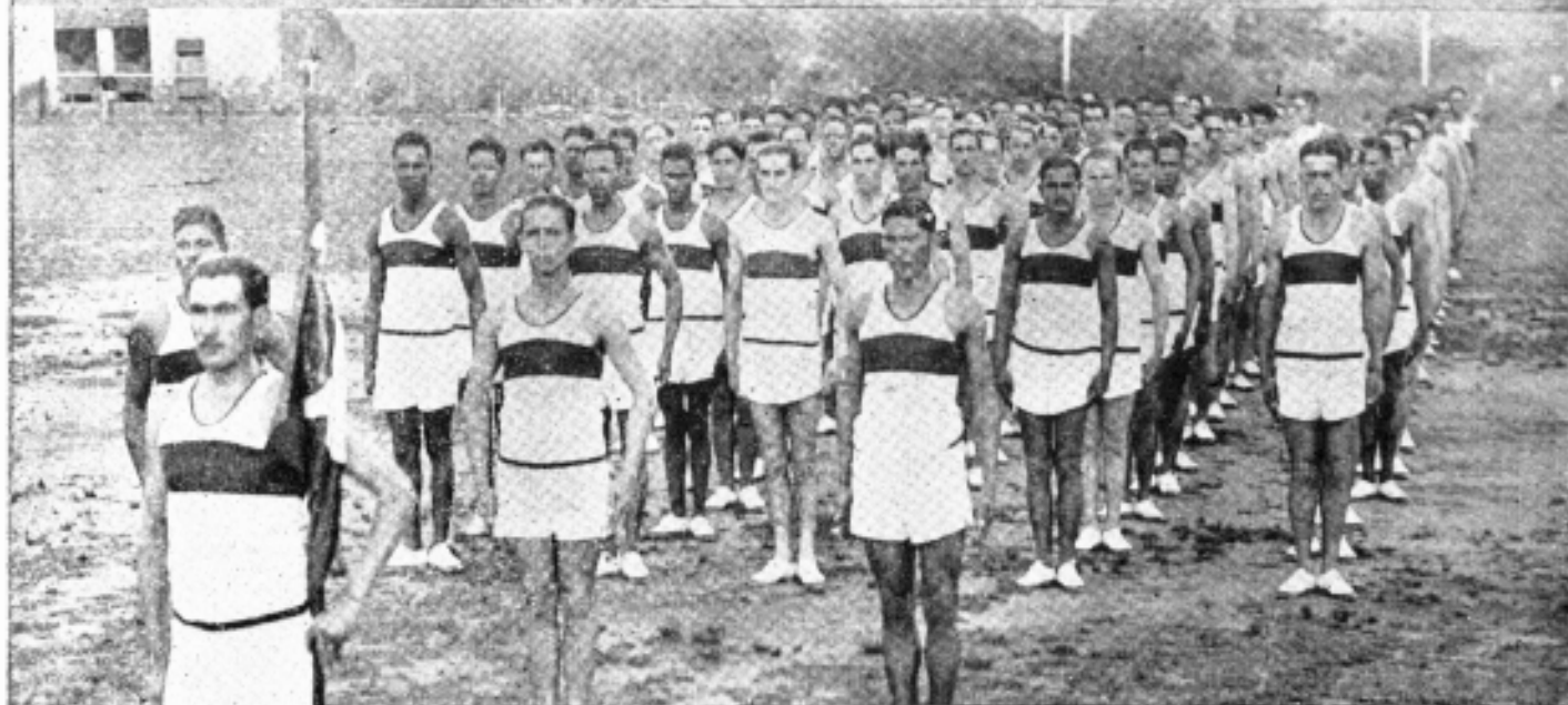
Atletas representantes do Regimento