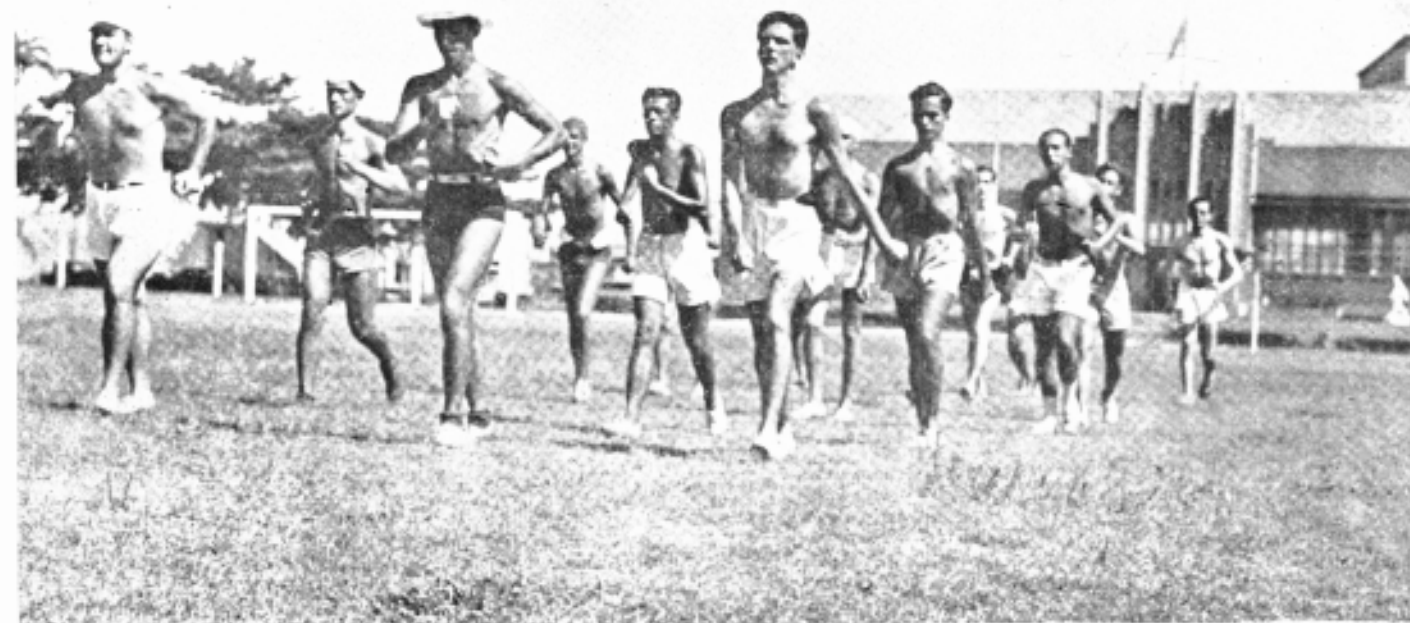
2º GRAU DO CICLO SECUNDARIO