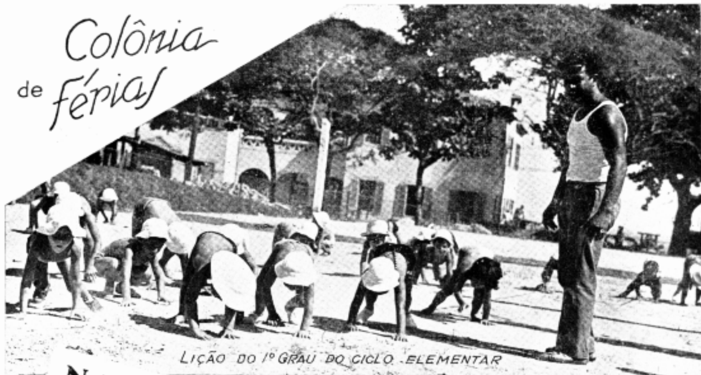
LIÇÃO DO 1º GRAU DO CICLO ELEMENTAR