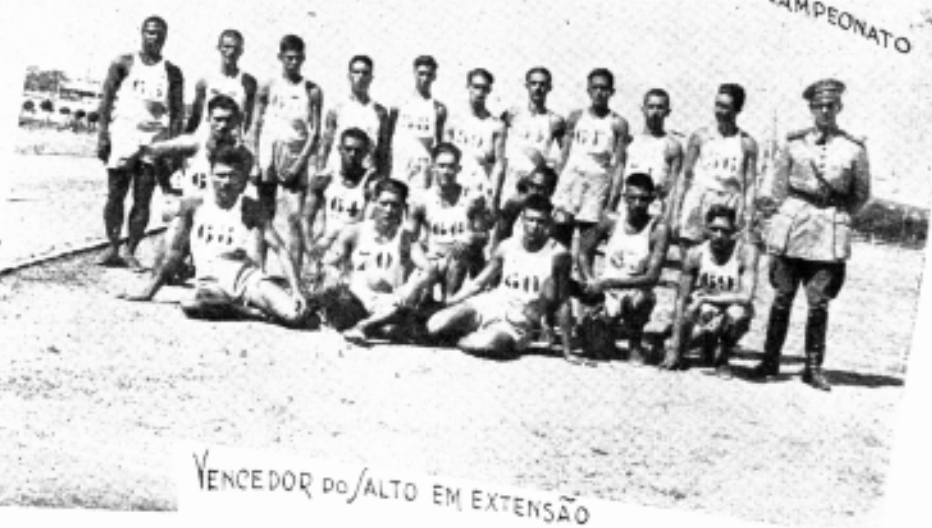
VENCEDORA DO CAMPEONATO