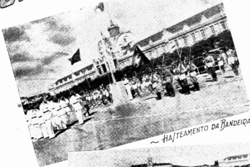
~ HASTEAMENTO DA BANDEIRA ~

As fotografias destas paginas são flagrantes do campeonato regional de atletismo da 3ª Região Militar. Elas demonstram,