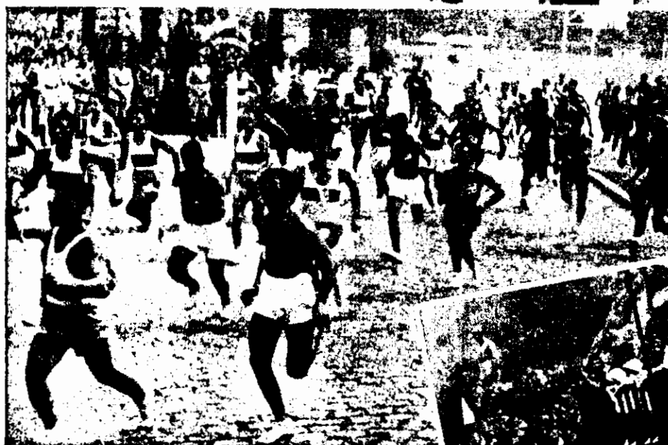
Um aspecto do "Cross COUNTRY"