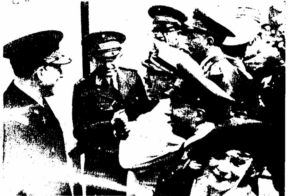
Abertura da competição