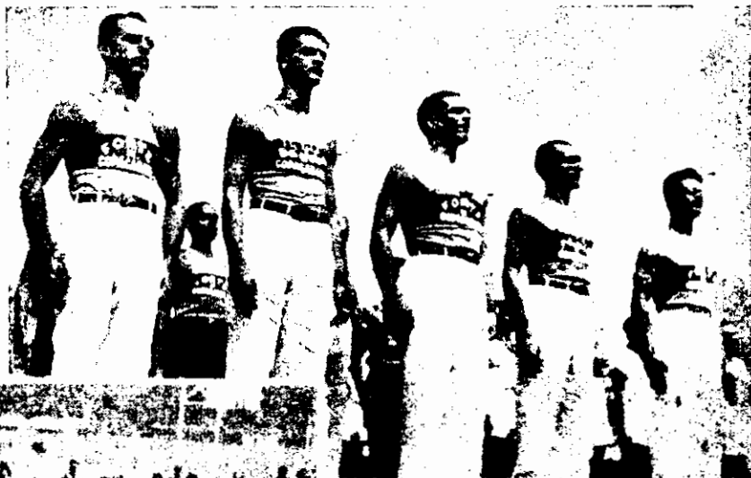
Oficiais atletas do Bate de Coracabana