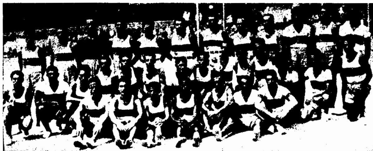
Uma das turmas desportivas