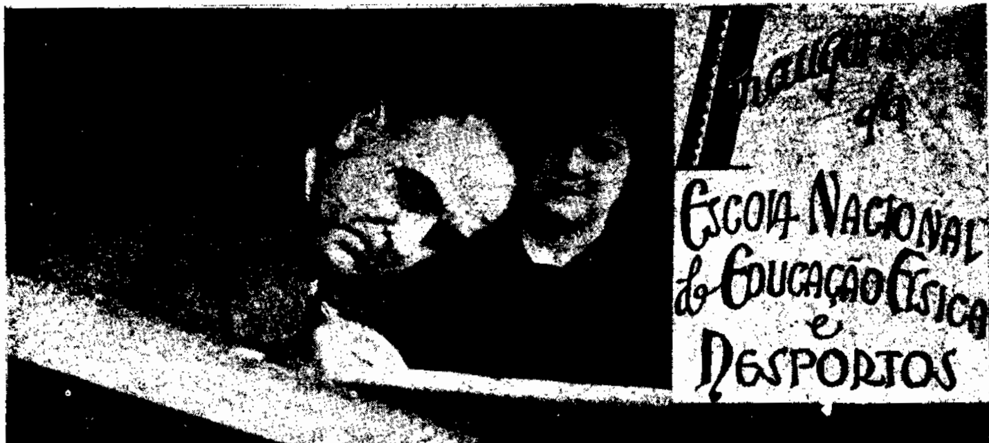
S. Excia. o Dr. Getúlio Vargas, Presidente da República, assinando a ata inaugural.

Perante o Exmo. Sr. Presidente da República e demais autoridades do país, inaugurou-se, no dia 1.º de agosto próximo passado, a Escola Nacional de Educação Física e Desportos.