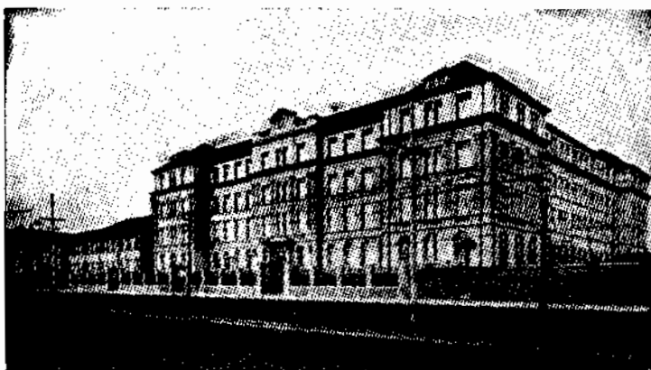
Vista geral do edifício do Colégio Arquidiocesano — Rua Domingos de Morais, 2565, São Paulo.

pondo de amplas dependências, dotado de todo conforto material, oferecendo assim as melhores condições de higiene e aproveitamento nos estudos.