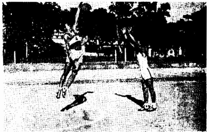
Fig. 2 A

Bloqueio — O defensor (de camisa escura e faixa branca) conseguiu se apossar da bola com um bloqueio bem executado.