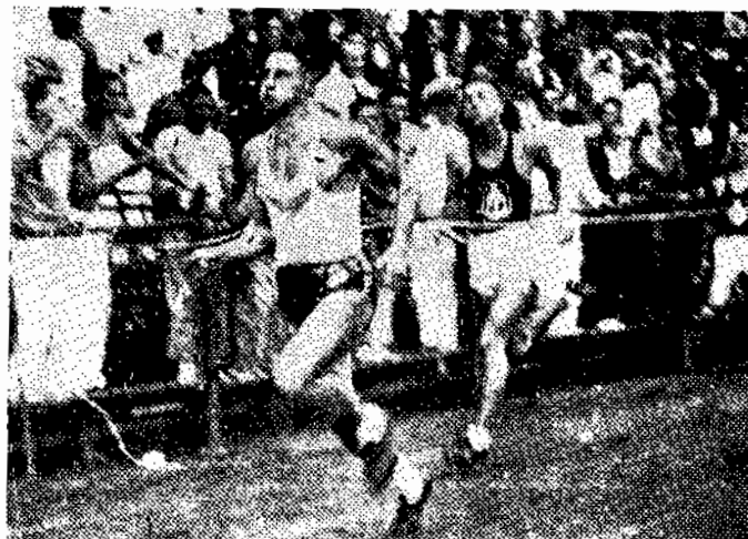
As provas foram disputadas com grande entusiasmo.