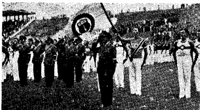
O pavilhão do D. D. E. desfraldado ao som do Hino Nacional.