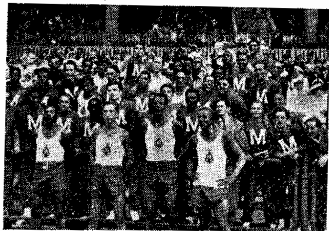
Representantes da Marinha.

Chamamos especial atenção dos delegados do D.D.E., que são todos os oficiais encarregados da Educação Física nos Corpos de Tropa e Estabelecimentos Militares, bem como os oficiais regionais de Educação Física, para que observem com rigór as Instruções e Regulamentos baixados pelo D.D.E., afim de que as atividades esportivas sejam realizadas nas épocas previstas, dentro do melhor espirito de cordialidade e ordem, para que possamos, daqui por diante, manter o ritmo capaz de levar o esporte militar ao mais alto grau de aperfeiçoamento.