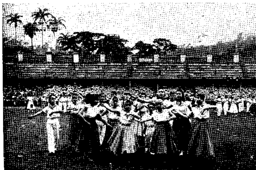
ARRANJO DE DANÇAS BRASILEIRAS: — O MARACATU.