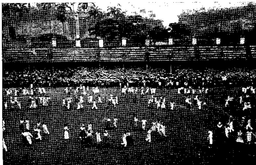
„CAMPTOWN RACES” (QUADRILHA AMERICANA) — A CADEIA DE GINÁSTICA.

Nesta página, focalizamos alguns aspectos sugestivos do FESTIVAL DE EDUCAÇÃO FÍSICA realizado no dia 31 de outubro do ano passado pelos alunos das ESCOLAS DA PREFEITURA DO DISTRITO FEDERAL , sob a orientação técnica do SERVIÇO DE EDUCAÇÃO FÍSICA E RECREAÇÃO DO DEPARTAMENTO DE EDUCAÇÃO COMPLEMENTAR .