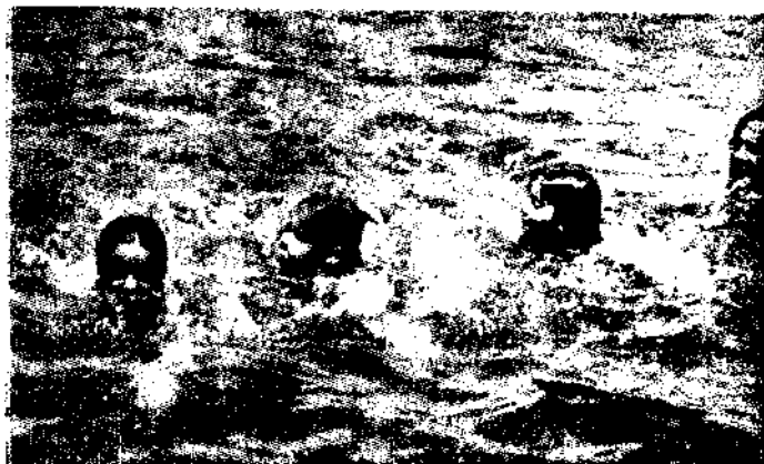
Aula de Natação (administrada a todas as turmas).