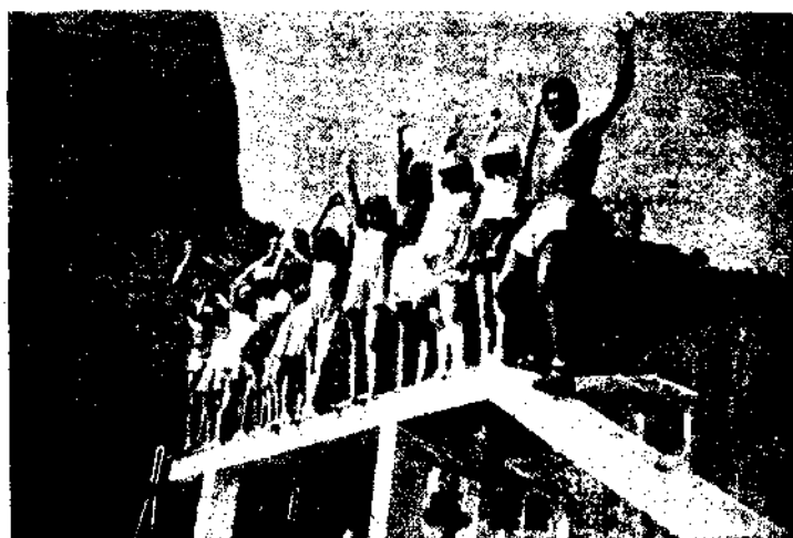
3.º e 4.º Graus do Ciclo Elementar (Exercício de equilíbrio e controle do sistema nervoso no pórtico medido).