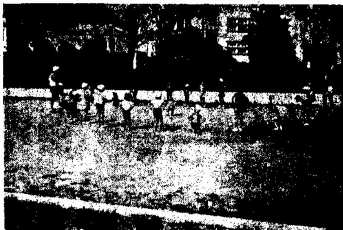
Turma do 2.º Grau do Ciclo-Elementar

com o sexo e a idade, de tal modo que os mesmos exercícios sejam seguidos, tanto quanto possível, por alunos do mesmo valor fisiológico.