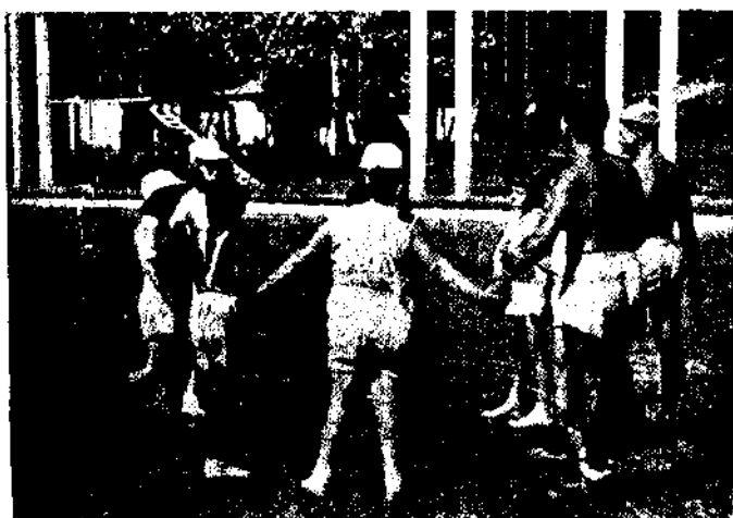
Alunas do 3.º Grau do Ciclo Elementar (Educação física pré-pubertária) Exercícios de roda com cantos infantis.