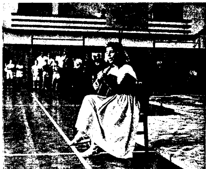
Um número de violão executado por uma aluna da Colônia, na Festa de Encerramento.