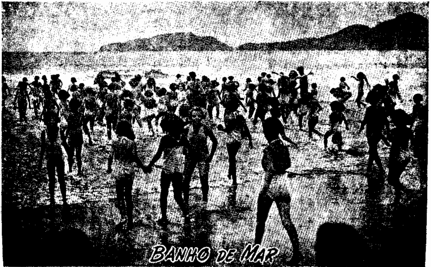
BANHO DE MAR

Assim, louvamos a obra construtiva dos dirigentes da Colônia Marítima Infantil "Alvaro Guíão" e auguramos-lhes prosperidade a fim de que continuem com tão altruístico empreendimento em benefício da saúde e desenvolvimento físico da nossa gente.