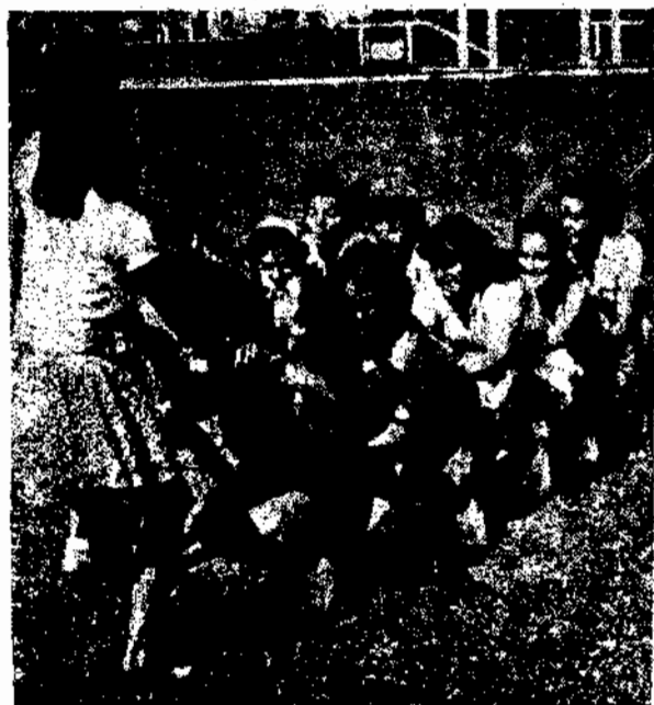
Educação Física Feminina.

Este ano o numero de candidatos elevou-se a 296, o que bém comprova o interesse crescente dos que procuram assegurar a saúde, pela prática racional da Educação Física.