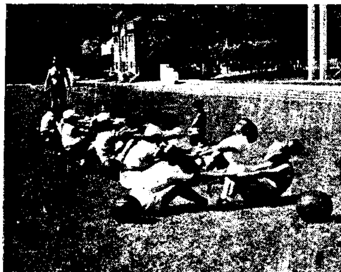
Alunas do Ciclo Superior (Educação física feminina).