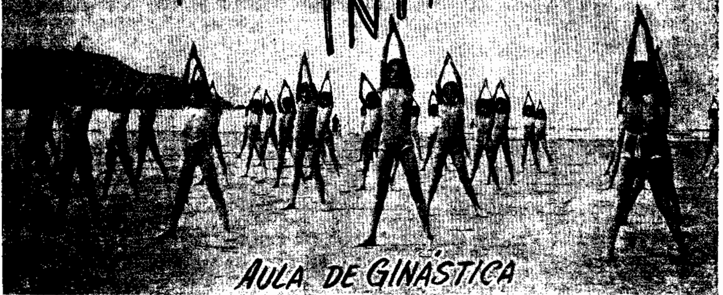
AULA DE GINÁSTICA

No Brasil a Educação Física ainda não está bastante organizada no meio civil em geral, pois ainda não é possível ao indivíduo nas suas ocupações diárias ou às crianças nas escolas, praticarem os esportes ou a ginástica diariamente, a fim de se manterem em boas condições físicas.