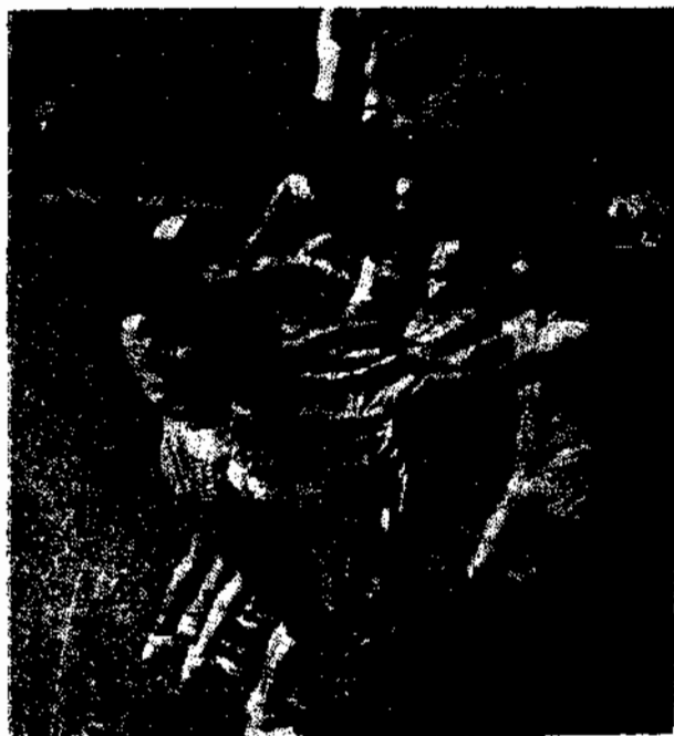
Alunas do 2.º Grau do Ciclo Secundário