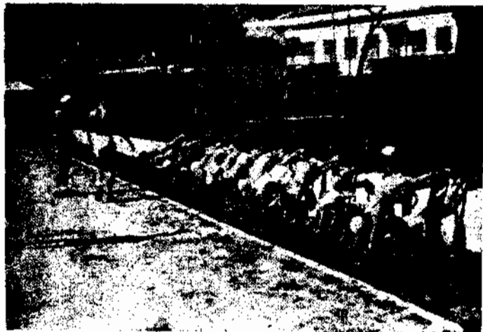
Turma do 1.º Grau do Ciclo Elementar

volver uma atividade física suficiente e que desejam aproveitar ao máximo os benefícios da praia. Antes de serem matriculados na Colônia de Férias, são os novos alunos submetidos a um rigoroso exame médico, após o qual são reunidos em grupamentos homogêneos de acôrdo