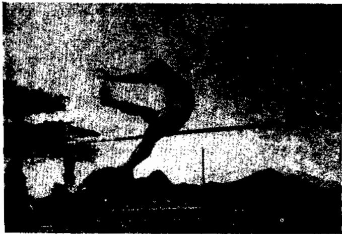
Prova de Salto em Altura