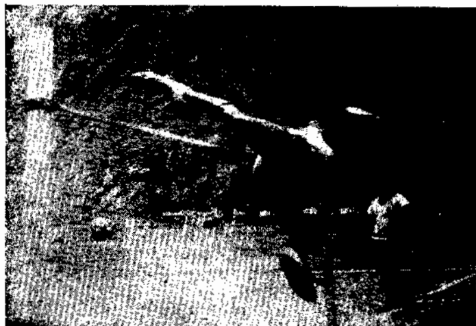
Prova de Salto em Altura