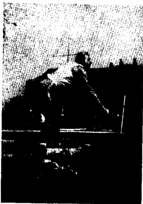
Vencedor do Pentatlon Atlético Competição dos Sargentos)