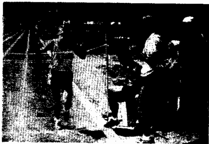
Prova de 3.000 metros