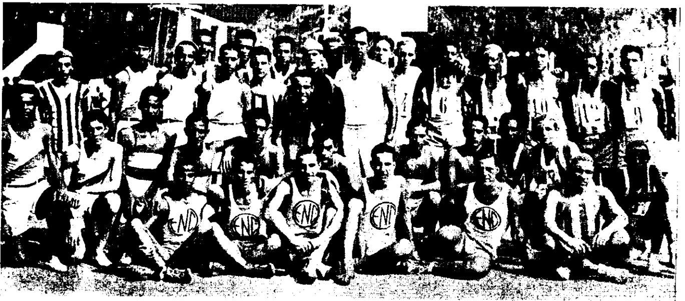
O: numerosos quadros disputantes do Torneio, em pose para a Revista de Educação Física.—Em cima, algumas representantes do belo sexo, que se incluíram nos quadros, ornando-os com sua graça e beleza