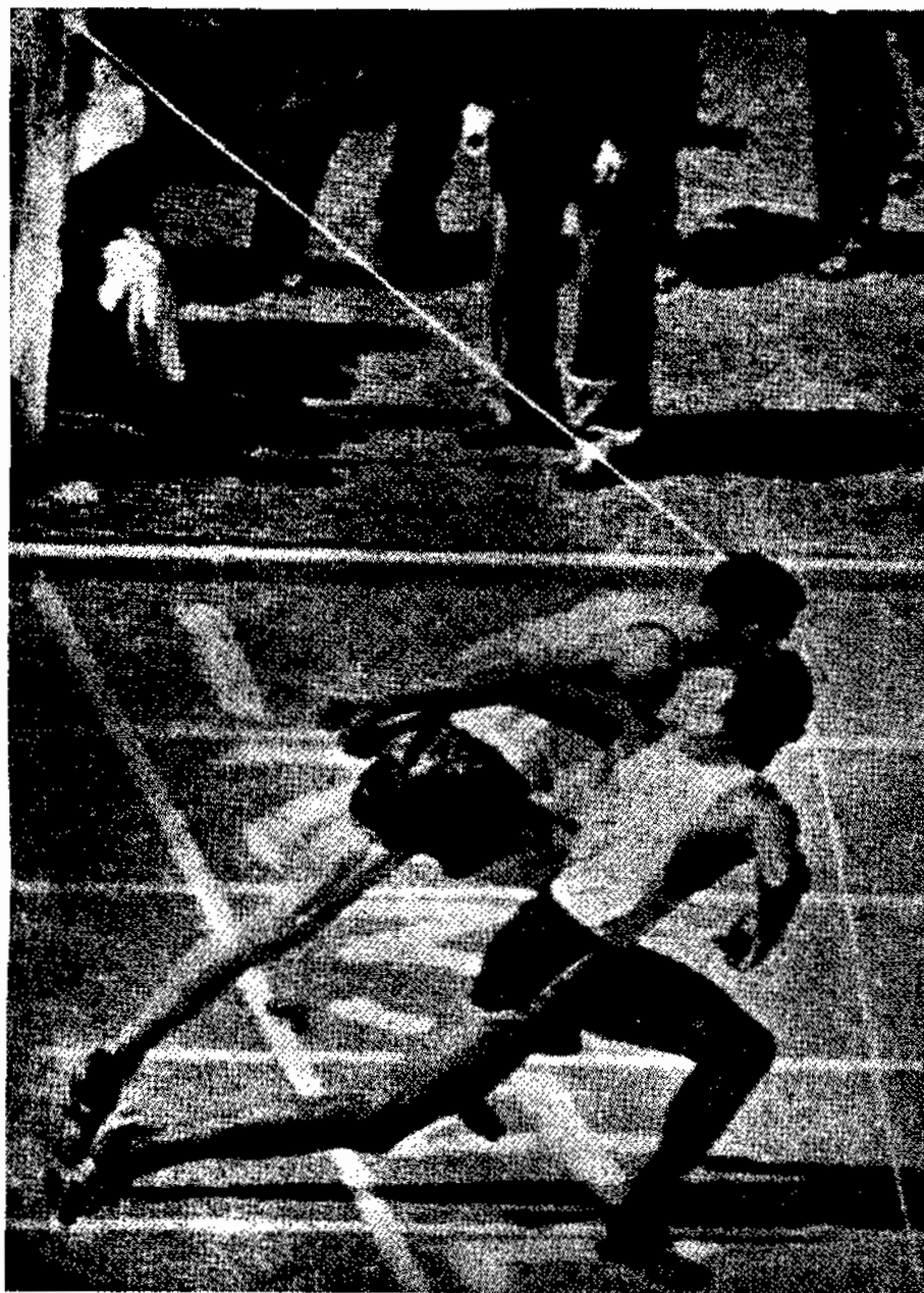
Empate sensacional nos 110 mts. c/ barreiras, entre Jack Davis e Lee Calhoun