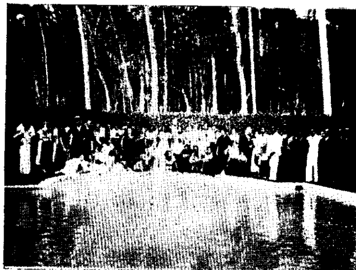
A CARAVANA NA FAZENDA "PRADA", EM SANTA RITA

(Trecho da Mensagem Presidencial apresentada ao Congresso Nacional, em 3 de maio deste ano.)