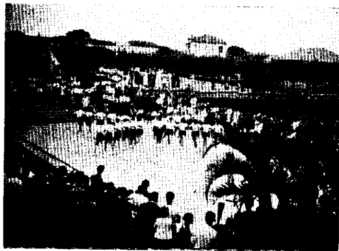
NA ESCOLA NORMAL DE PIRASSUNUNGA — DEMONSTRAÇÃO DE EDUCAÇÃO FÍSICA FEMININA

Outro fato, digno de registro, dos anais da Associação, foi a defesa em que se empenhou contra o desvirtuamento da educação física, pretendido por interesseiros, com o fim de entregar a árdua missão de educar o físico a pessoas desprovidas de títulos de habilitação, fato que repercutiu de modo estranho na Assembléia Estadual.