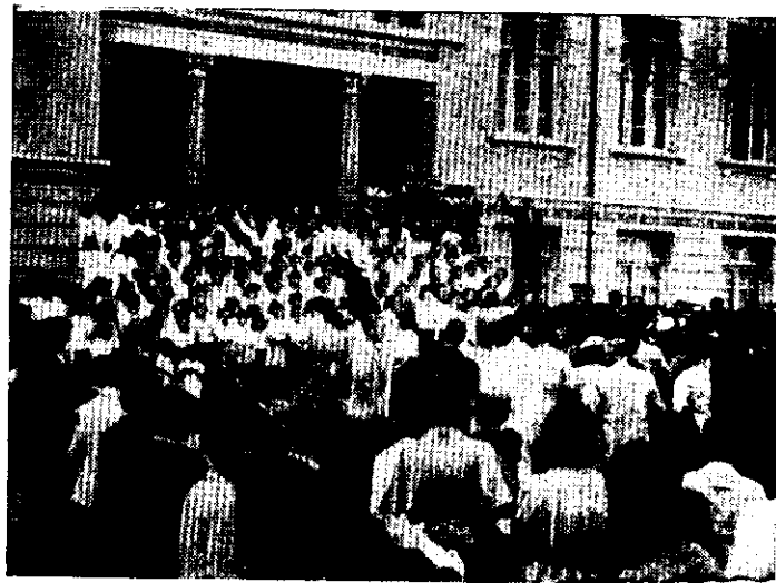
NA ESCOLA NORMAL DE CASA BRANCA. — A RECEPÇÃO DA CARAVANA PELA JUVENTUDE ESCOLAR TEVE BRILHO INCOMUM