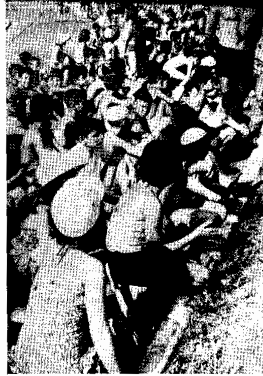
A garotada da Colônia de Férias, respondendo à chamada diária aguarda ansiosa o início das Aulas de Recreação.

Dentre os aperfeiçoamentos êste ano introduzidos devem-se notar a ampliação do "Play-Ground" para 20 aparelhos e a delimitação feita na praia, por uma corda, na qual amarraram-se 22 bóias de pneu de automóvel, que, além de oferecer maior segu-