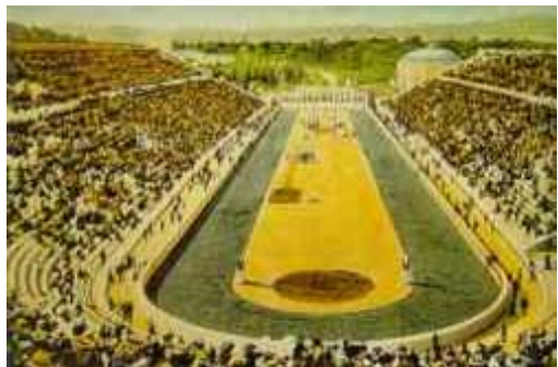
Jogos Olímpicos de Atenas em 1896