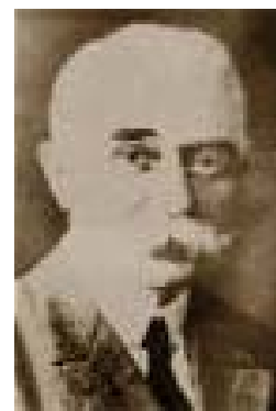
Barão de Coubertin

A participação do Brasil só se deu a partir de 1920, nos VII Jogos Olímpicos da Antuérpia, Bélgica, atendendo a um convite do Comitê Olímpico Internacional.