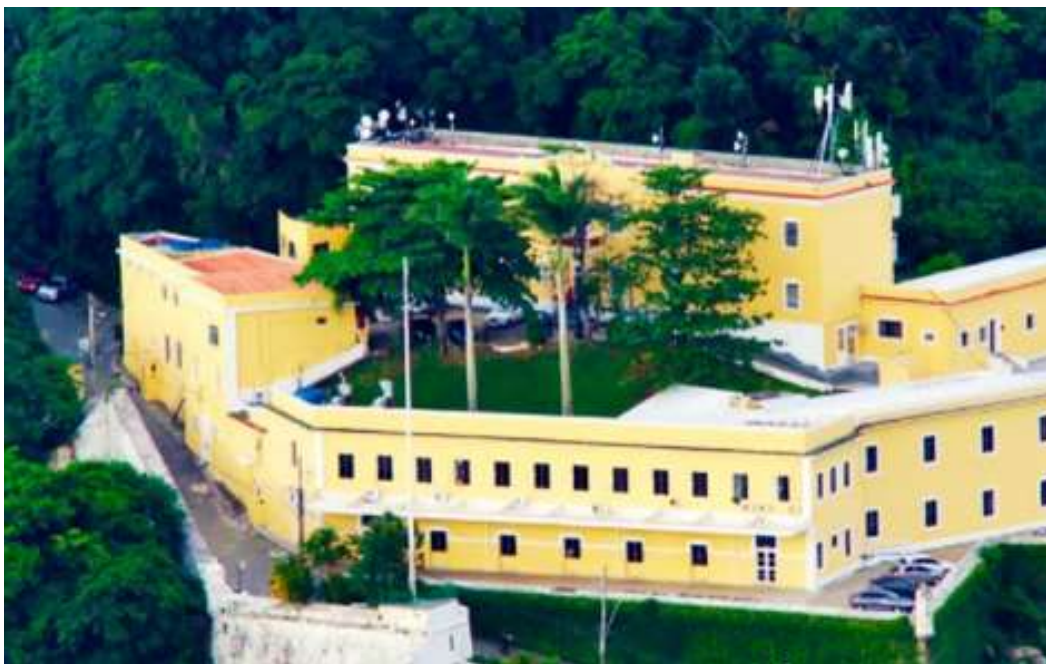
Figura 7 – Bateria de Comando e Serviço da Fortaleza de São João – Bateria Estácio de Sá.

A Bia C Sv/FSJ – Estácio de Sá é a mantenedora da história e das tradições das organizações militares de Artilharia, sendo considerada, dessa forma, como a mais antiga a atuar no Rio de Janeiro. Destina-se a apoiar em pessoal o CCFEx, provendo a segurança e a manutenção do aquartelamento, além de auxiliar na preservação do sítio histórico, fauna e flora do Morro Cara de Cão (Figura 7).