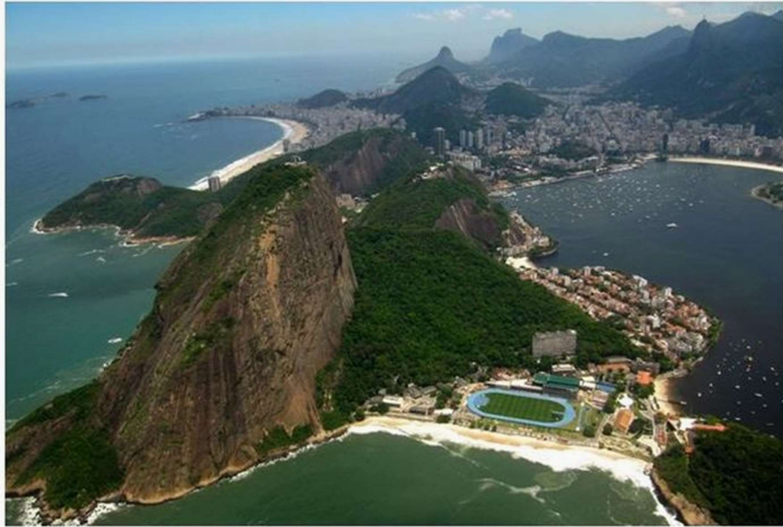
Figura 1 – Centro de Capacitação Física do Exército (CCFEx) e Fortaleza de São João (FSJ), em 2022.

Comando, Escola de Educação Física do Exército (EsEFEx)(5), Comissão de Desportos do Exército (CDE)(6), Bateria Estácio de Sá e Instituto de Pesquisa da Capacitação Física (Núcleo)(7) (Figuras 1 e 2).