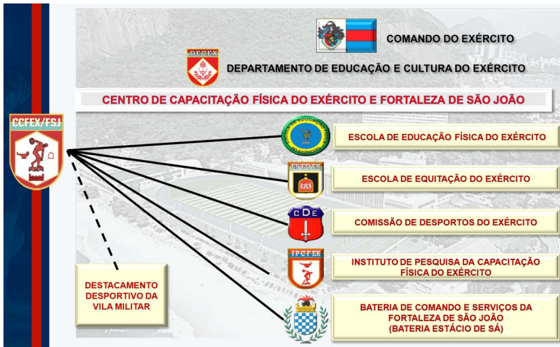
Figura 2 – Estrutura organizacional do Centro de Capacitação Física do Exército (2022).