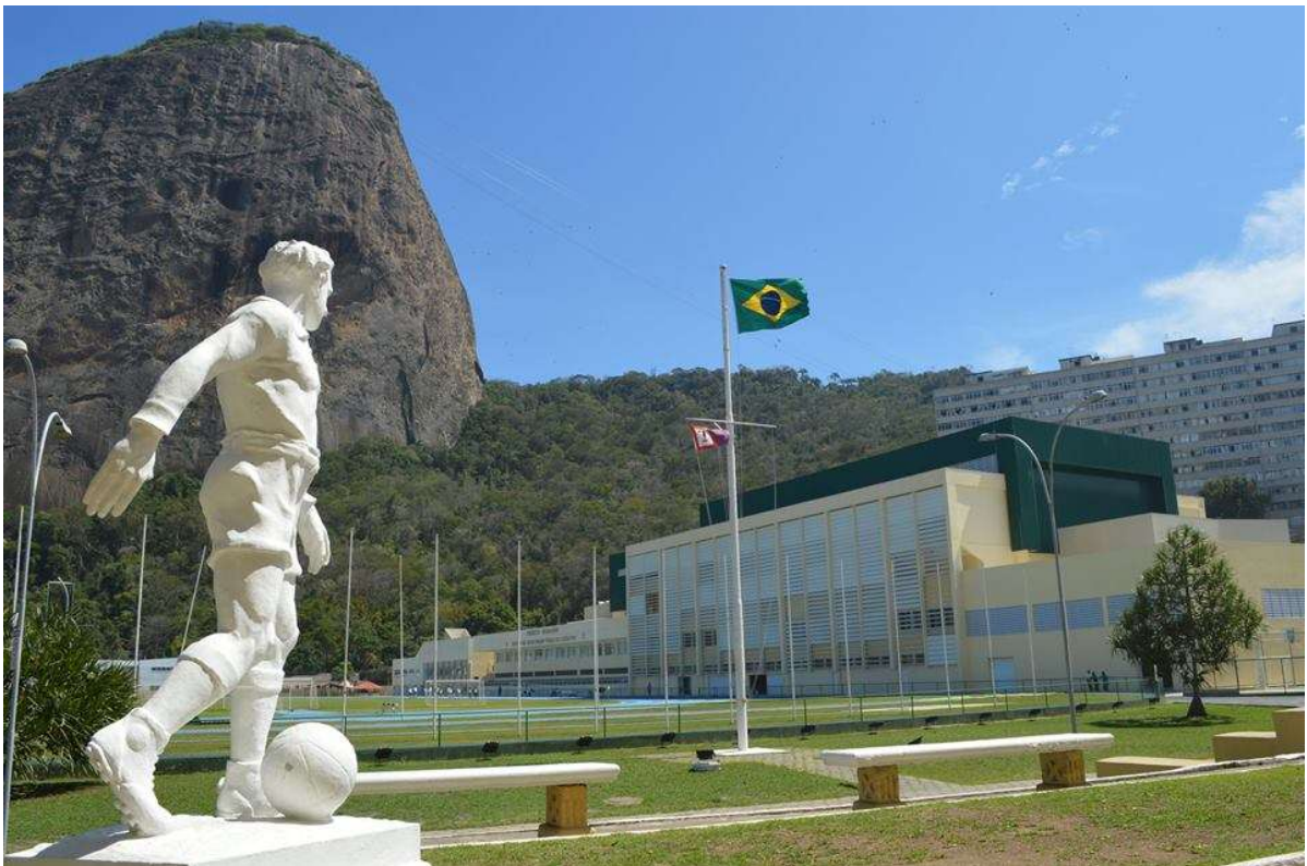
Figura 4 – Escola de Educação Física do Exército (EsEFEx).

No corrente, a EsEFEx completou o seu primeiro centenário e, até o momento, foram formados mais de 8.400 Calções Pretos – oficiais no Curso de Instrutor de Educação Física, sargentos no Curso de Monitor de Educação Física, militares e civis nos Cursos de Mestre D’Armas e de Medicina Esportiva, além de praças no extinto curso de Monitor de Esgrima, originários de todos os estados do país e de nações amigas, incluindo militares das Forças Armadas, das Forças Auxiliares e civis.