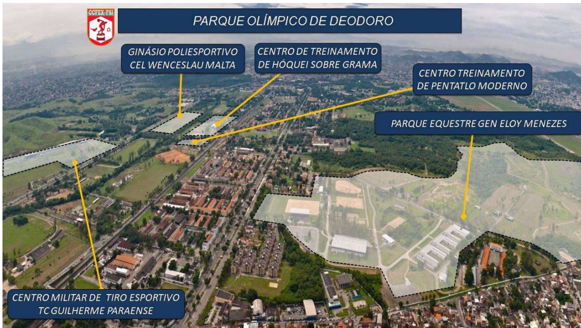
Figura 8 – Legado Olímpico da Vila, Destacamento Desportivo da Vila Militar (DDVM)

financiadas pelo Governo Federal, em áreas jurisdicionais ao Exército, a saber: Centro Militar de Tiro Esportivo – Tenente Coronel Guilherme Paraense; Ginásio Poliesportivo Arena Coronel Wenceslau Malta; Centro de Treinamento de Hóquei sobre Grama Sargento João Carlos de Oliveira, e o Centro de Treinamento de Pentatlo Moderno Coronel Eric Tinoco Marques (Figura 8)