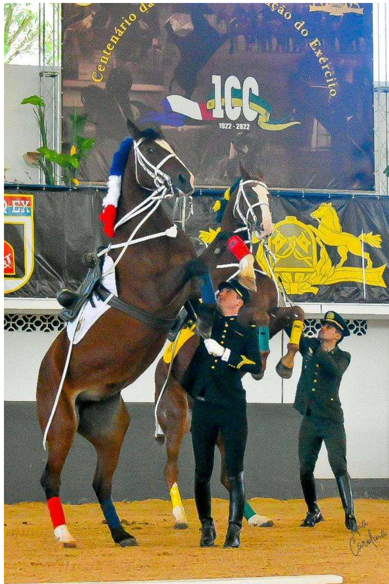
Figura 5 – Escola de Equitação do Exército (EsEqEx).

Adicionalmente, realiza pesquisas no campo da equitação e da genética equina; apoia as OM de Cavalaria e os Estabelecimentos de Ensino do Exército, nos assuntos pertinentes ao ensino de Equitação, como órgão técnico-normativo; incentiva o desenvolvimento do hipismo; apoia o escalão superior na promoção e realização de competições militares de caráter nacional e internacional e na organização, treinamento e participação das equipes do Exército e das Forças Armadas; e coopera com entidades civis e militares, nacionais e internacionais, de acordo com programas de interesse mútuo fixados pelo escalão superior (Figura 5).