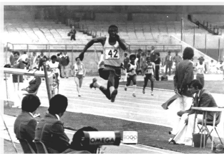
Figura 3 - João do Pulo, nos Jogos Olímpicos de Moscou (1980)(9,16)