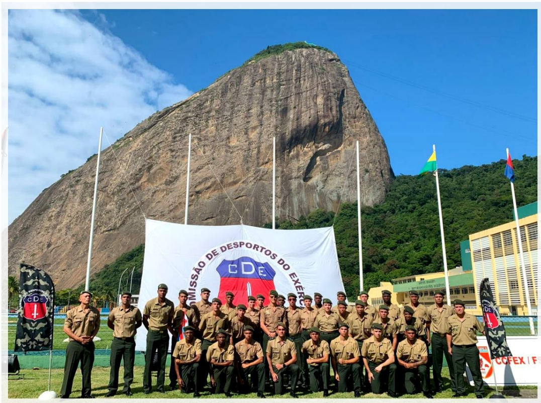
Figura 6 – Time Comissão dos Desportos do Exército (CDE)(1)

nacional (Figura 6). Cada uma dessas áreas utiliza o esporte como uma ferramenta poderosa para promover a saúde, desenvolver valores e estreitar laços de camaradagem e respeito(1).