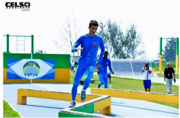
Figura 5 – Capitão Douglas Castro Bicampeão Mundial de Pentatlo Militar(10–13).