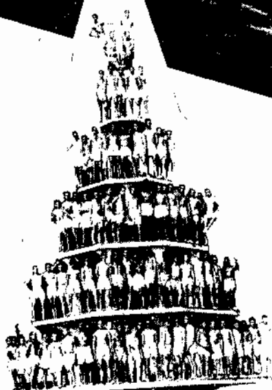
1.º — Uma aula de Educação Física 2.º — Treinando "canoagem" 3.º — Torre de escalada-guarnecida