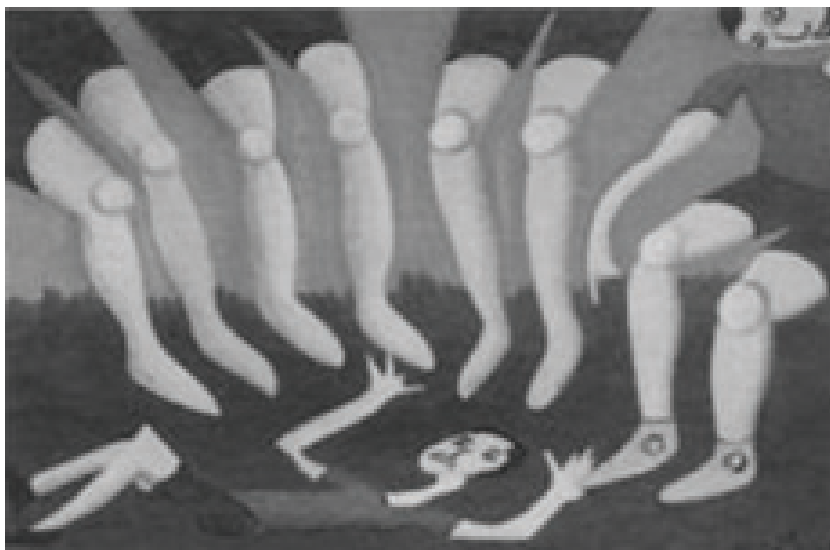
FIGURA 1 ALVO DE BULLYING

São os(as) alunos(as) que só praticam bullying . Os autores são indivíduos que têm pouca empatia. Além disso, são mais fortes do que seus colegas de classe, o que lhes