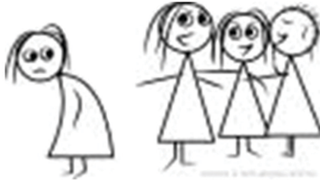
FIGURA 6 BULLYING ENTRE MENINAS.