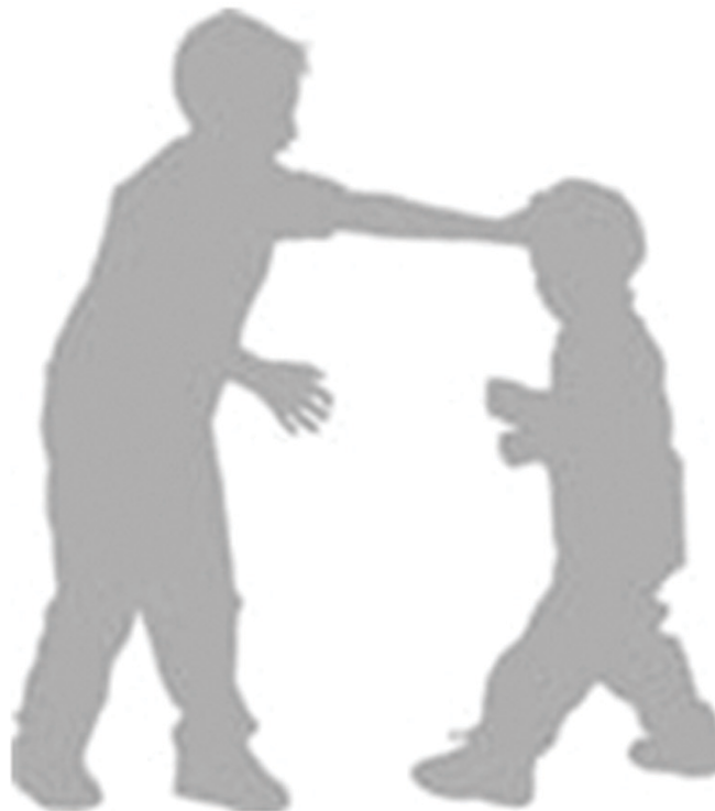
FIGURA 3 AUTOR DE BULLYING .