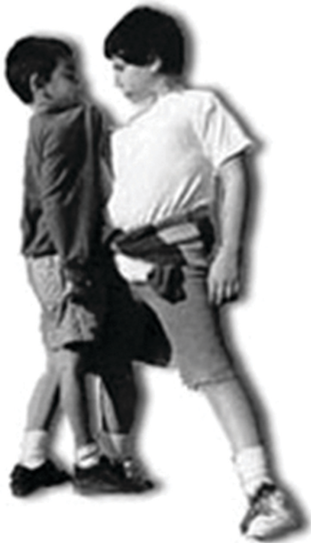
FIGURA 5 BULLYING ENTRE MENINOS.