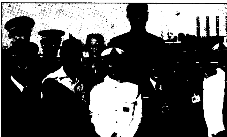
O gigante Chinês. A equipe nacional da República Popular da China participou do evento.