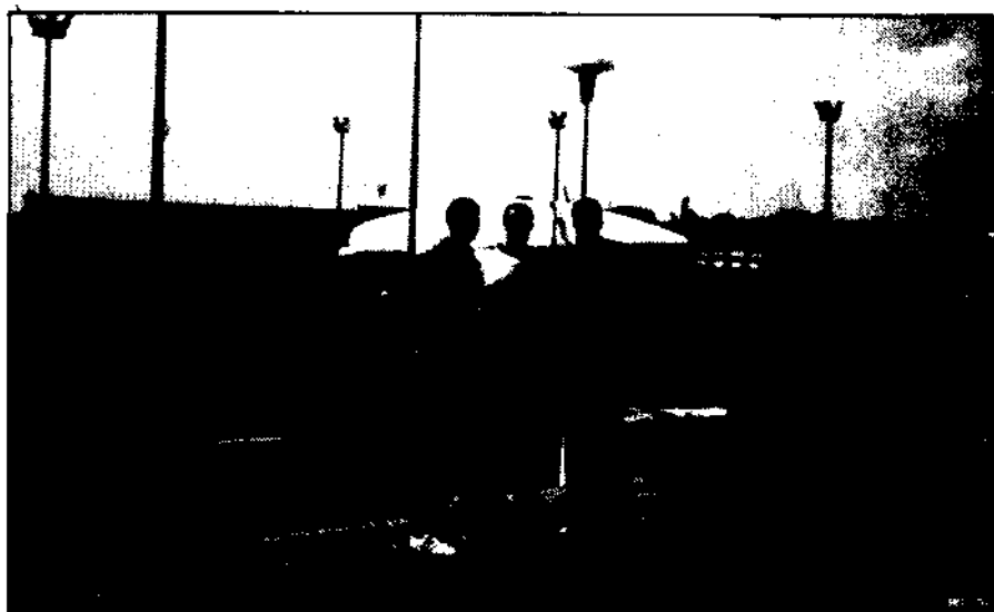
Atletas do Senegal: Média da equipe, 2,03m.

Cabe ressaltar que mais de 90% dos jogadores das equipes participantes eram Praças.