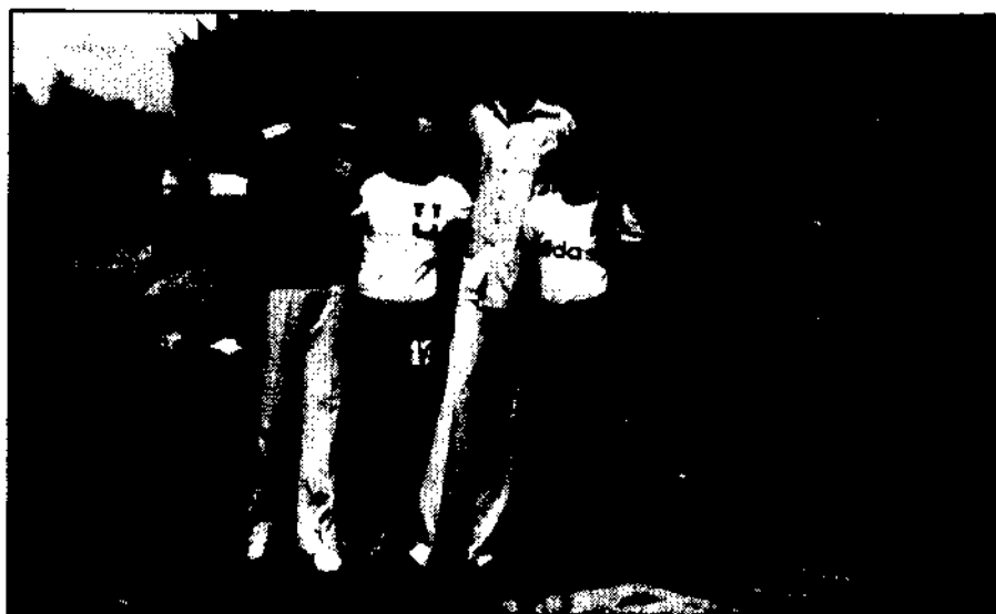
Atletas do Sudão: o mais alto tem 2,27m; o atleta brasileiro, ao centro, tem 1,90m.