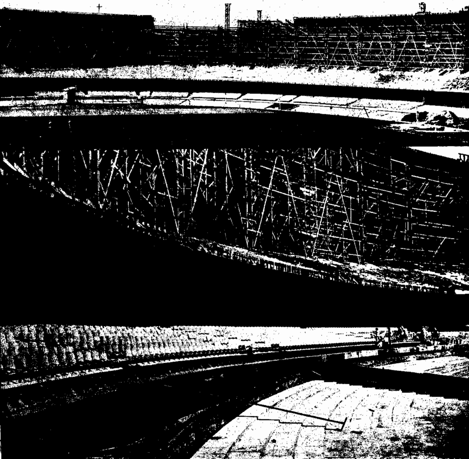
VISTAS PARCIAIS DA CONSTRUÇÃO DO ESTÁDIO MUNICIPAL QU