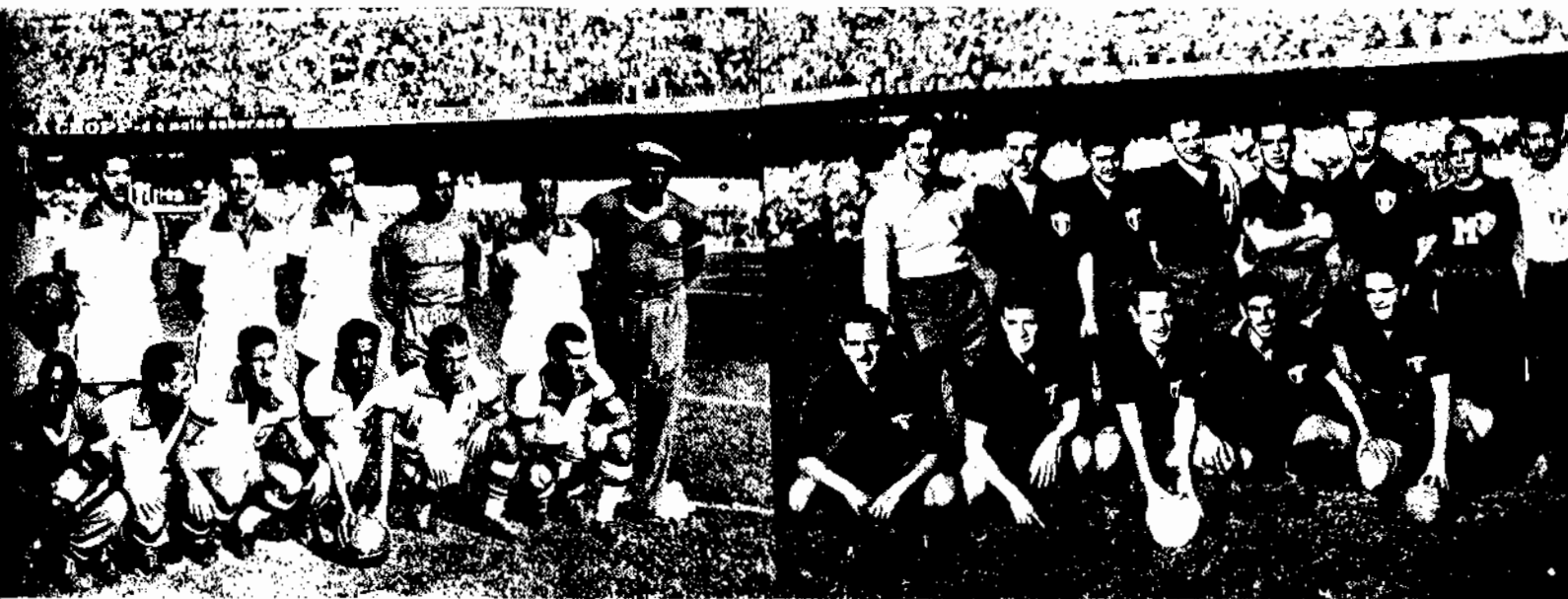
Selecionado do BRASIL

Renda — Cr$ 2.565.000,00 (Récorde Sul-Americano).