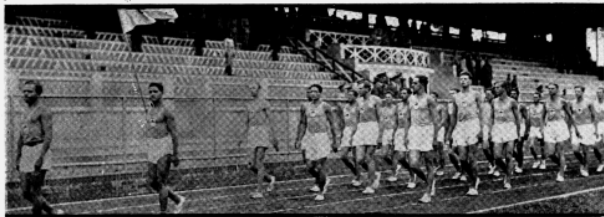
O DESFILE DOS ATLETAS EM CONTINUIDADE ÀS AUTORIDADES, ANTES DAS COMPETIÇÕES