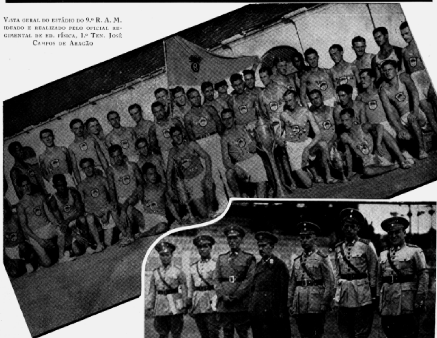
A REPRESENTAÇÃO DO 9.º R. A. M., CAM- PEÃ REGIONAL DE ATLETISMO DE 1937. — A COMISSÃO DESPORTIVA REGIONAL LADEANDO O SR. GENERAL COMANDANTE DA 5. REGIÃO MILITAR