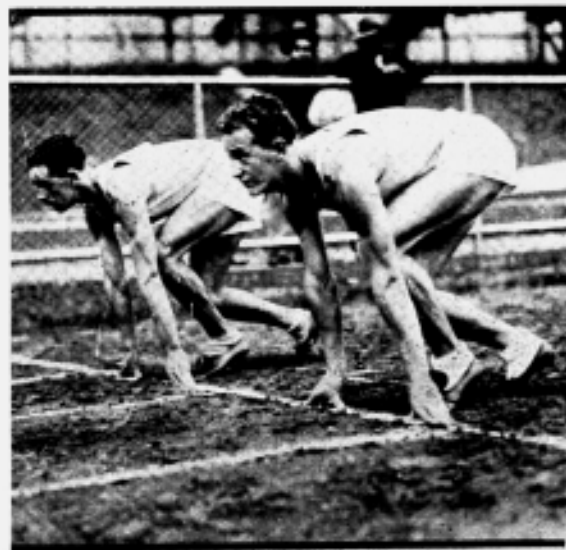
UMA PARTIDA DE ENEDY E GEBERT.