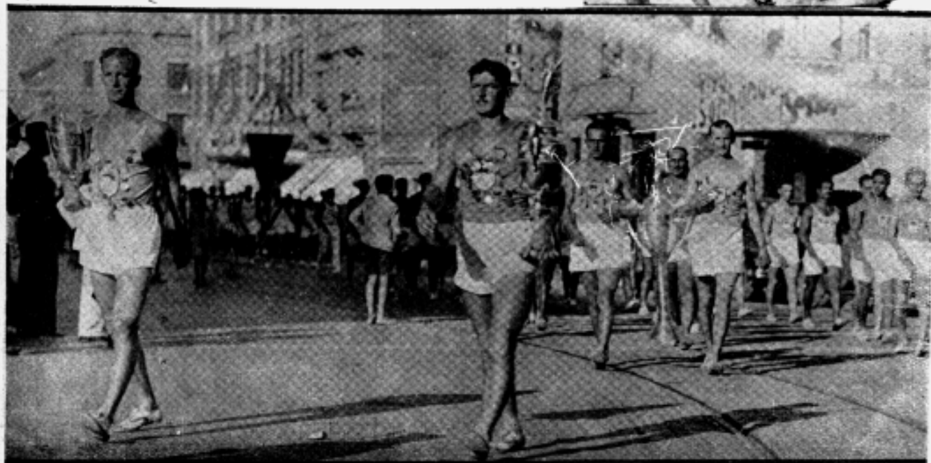
DESFILE DOS ATLETAS PELAS RUAS DE CURITIBA, COM SEUS TROFÉUS CONQUISTADOS