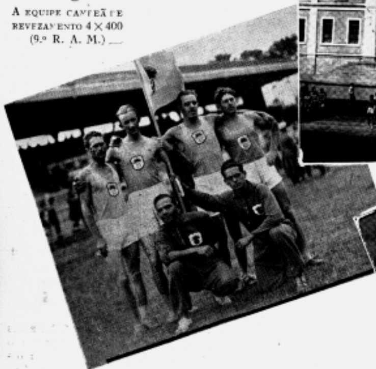
A EQUIPE CAMPEÃ DE REVEZAMENTO 4 X 400 (9.º R. A. M.)