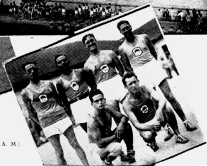
OS CAMPEÕES DE BASKET E VOLLEY (9.º R. A. M.)