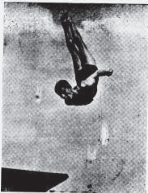
PROVA DE SALTO E MERGULHO. VENCEDOR, DE- GENES, (U.S.A.)

COM ESTAS SUGESTIVAS PALAVRAS DO GRANDE BARÃO FRANCÊS PIERRE DE COUBERTIN, O CRIADOR DAS MODERNAS OLIMPIADAS, COLCADAS EM UM "PLACARD" DE IMENSAS DIMENSÕES, ENCERRARAM-SE OS XI JOGOS OLÍMPICOS DE BERLIM, A 16 DE AGOSTO DÊSTE ANO.