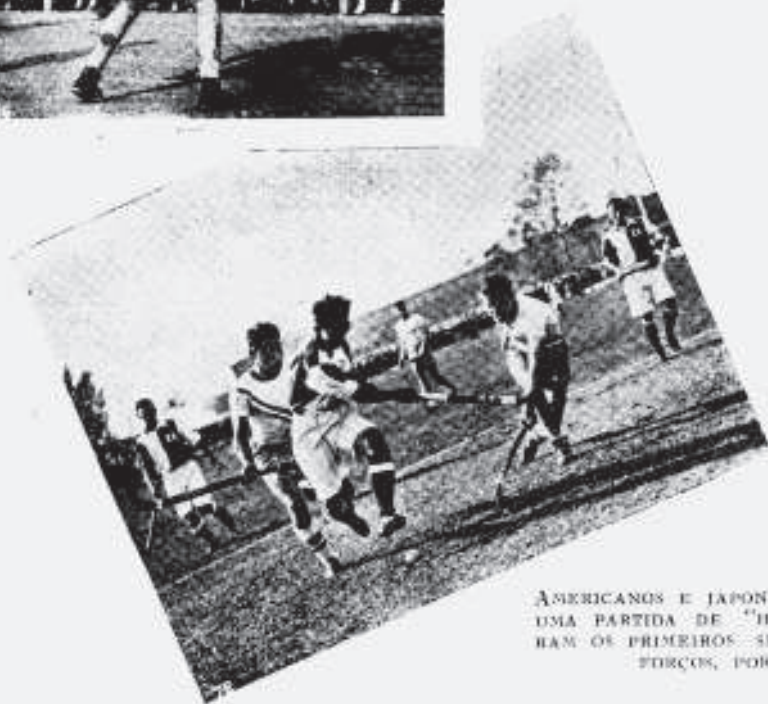
AMERICANOS E JAPONESES DISPUTANDO UMA PARTIDA DE "HOCKEY". VENCERAM OS PRIMEIROS SEM GRANDES ESFORÇOS, POR 5 X 1.