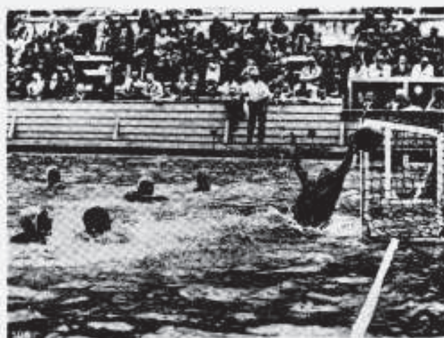
FLAGRANTE TOMADO DURANTE UMA DISPUTADÍSSIMA PARTIDA DE "WATER-POLO" ENTRE AS EQUIPES BELGA E URUGUAIA, NO MOMENTO EM QUE A META DOS SUÍ-AMERICANOS PERIGAVA. ESTA PARTIDA TERMINOU COM A VITÓRIA DOS BELGAS POR 2 X 1.