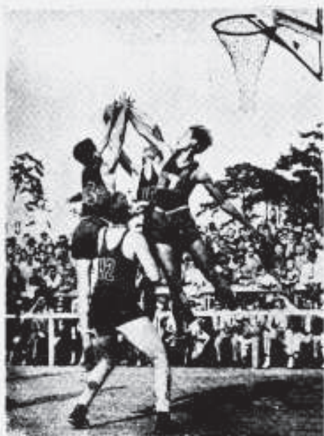
BASKET-BALL.—UMA PARTIDA ENTRE AS EQUIPES FILIPINA E MEXICANA, QUE TERMINOU FAVORÁVEL AOS FILIPINOS PELA APERTADA CONTAGEM DE 32 X 50.