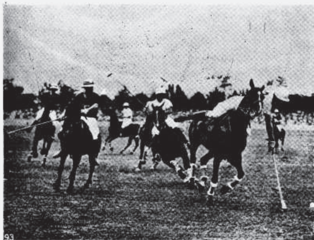
AS EQUIPES INGLESA E ARGENTINA DISPUTAM UMA PARTIDA DE PÓLO.