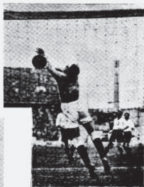
FUTEBOL.—NESTA PARTIDA, ENTRE POLONESES E NORUEGUESES, VENCERAM ESTES ÚLTIMOS PELA CONTAGEM DE 3 X 2. O FLAGRANTE MOSTRA O MOMENTO EM QUE UM VIOLENTO TIRO POLONÊS VASA A META NORUEGUESA, NÃO CONSEGUINDO O GUARDIÃO DEFENDÊ-LA.