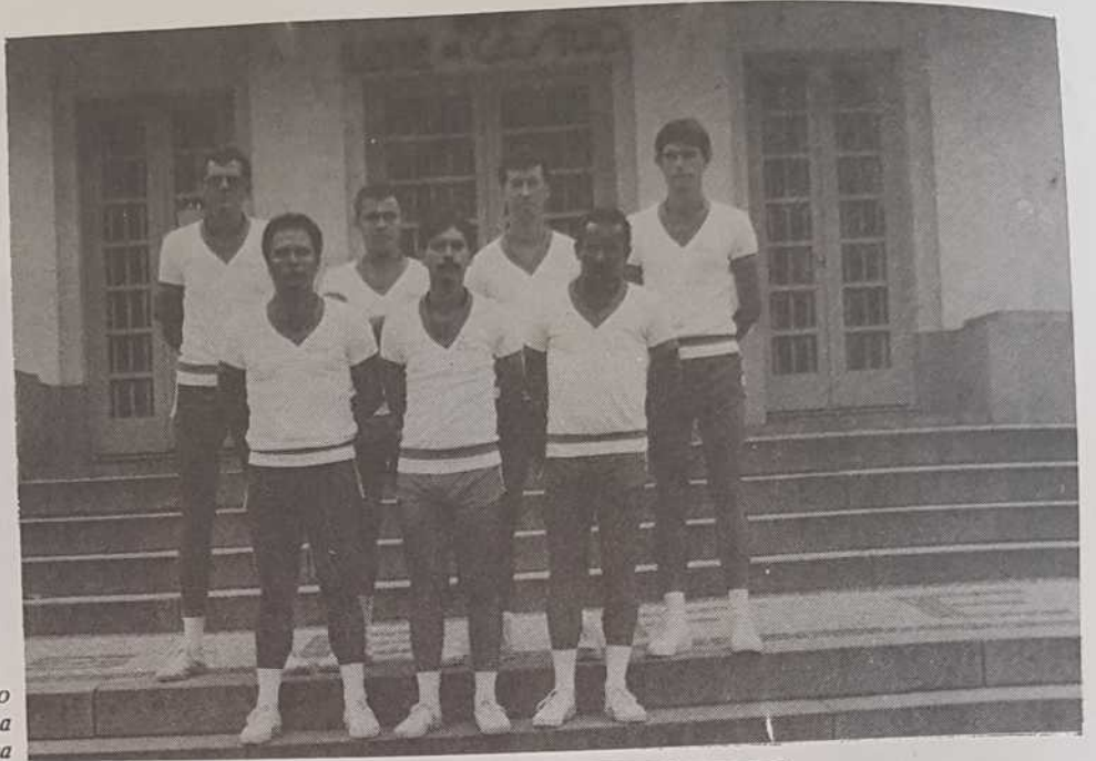
Oficiais Alunos do Curso de Medicina Desportiva