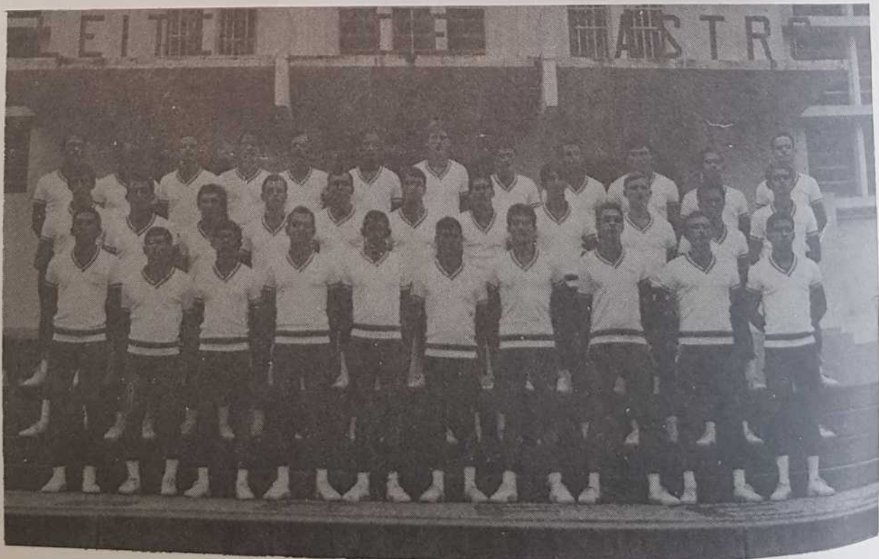
Sargentos Alunos do Curso de Monitor