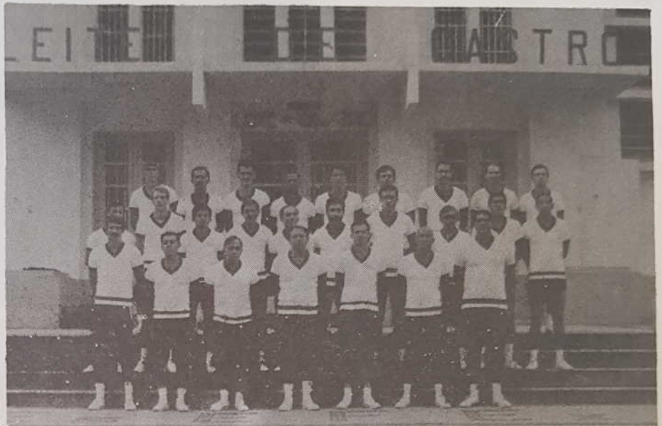
Oficiais do Corpo Permanente