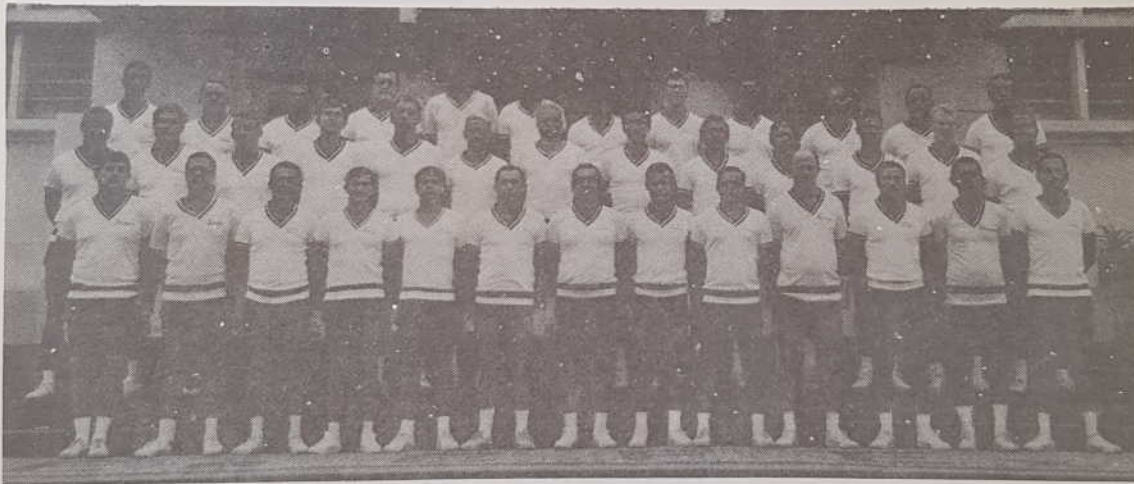
Sargentos do Corpo Permanente