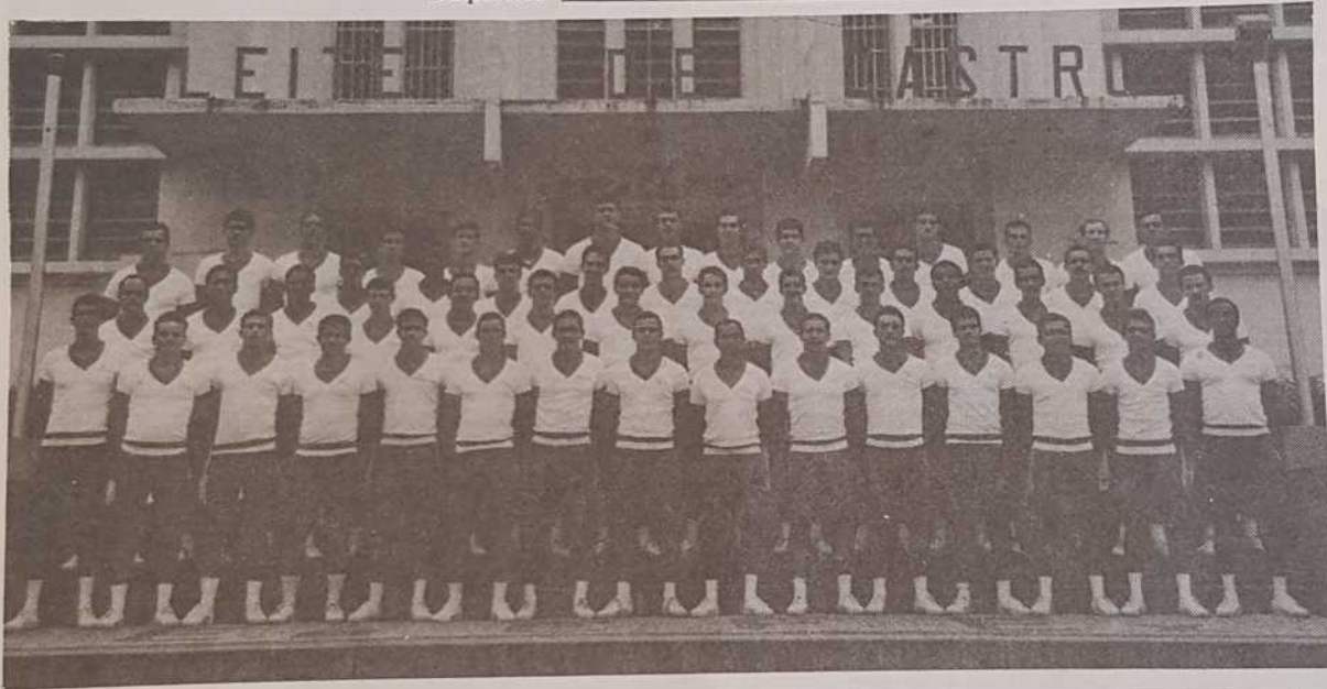
Oficiais Alunos do Curso de Instrutor