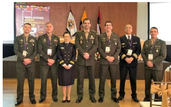
Participação no Simpósio Científico Internacional 2019 do “Conseil International du Sport Militaire” - CISM, na cidade de Quito, Equador.