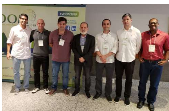
SIDOM 2019. Participação de militares e professor civil do IPCFEx.

Nessa mesma direção, o IPCFEx e a EsEFEx tradicionalmente também organizam eventos que visam proporcionar aos seus participantes um espaço para o aprofundamento científico e a troca de experiências, estreitando os laços acadêmicos entre diversas instituições de ensino e pesquisa, civis e militares. Neste ano, o XVIII Simpósio Internacional de Atividades Físicas e VI Fórum Científico ocorrerá nos dias 07, 08 e 09 de novembro, e contará com a presença de professores pertencentes a instituições nacionais e internacionais, civis e militares.