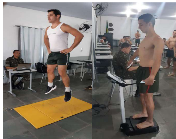
Avaliação do pico de potência de membros inferiores. A – Tapete de salto. B – Equipamento InBody.

Essa atividade foi composta pela medição da composição corporal por meio do equipamento InBody, pela avaliação do pico de potência de membros inferiores por meio da utilização de um tapete de salto e de testes de força de membros superiores utilizando dinamômetros.