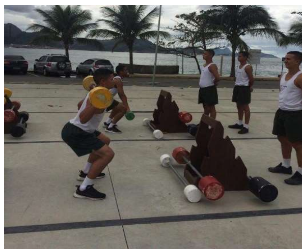
Treinamentos aplicados após a avaliação inicial: Pista de treinamento em circuito.