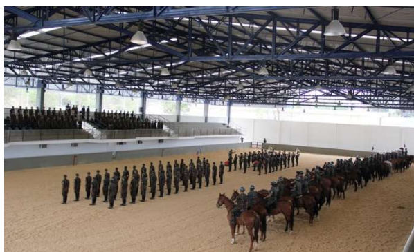
Parque Equestre General Eloy Menezes.

Possibilidades: arquibancada para 1.000 pessoas, auditório, salas, posto médico, pista de cross-country, 06 picadeiros abertos e 01 picadeiro coberto.