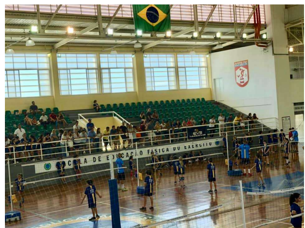
Volley Challenge EVB 2019, evento da Escola de Vôlei do Bernardinho (EVB), sediado pela EsEFEx.

Participaram do evento, crianças de toda a cidade do Rio de Janeiro, de variados núcleos, sediados em diferentes bairros da cidade, como Tijuca, Botafogo, Del Castilho e Barra.