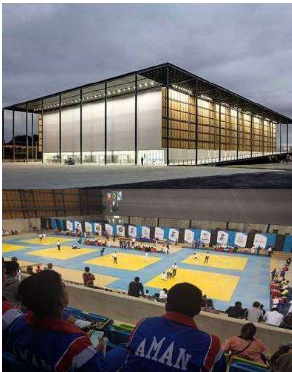
Ginásio Poliesportivo Arena Coronel Wenceslau Malta.

Principais Eventos: World Cup, Mundial, Pan-Americano e Sul Americano de Jiu-Jitsu; Copa Internacional de Judô; Carioca de Basquete; entre outros.