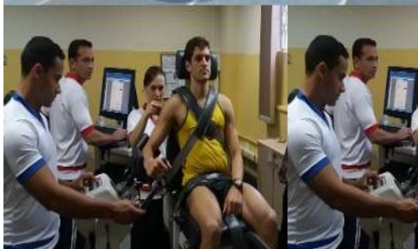
Alunos do curso de Instrutor de Educação Física acompanhando atividades de coleta da pesquisa relativa à Doutrina da Capacitação Física.