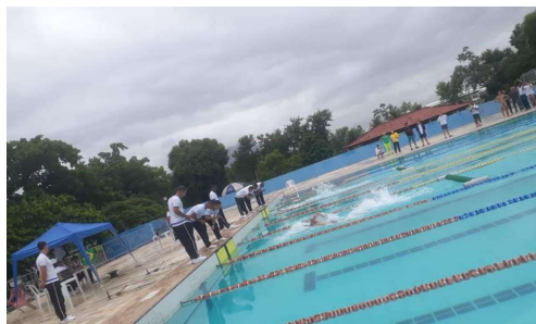
Participação dos alunos no Torneio Mundial de Pentatlo Militar como árbitros.