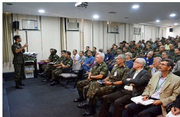
Palestra ministrada pelo TC Soeiro ao Cmdo do DECEEx.

Após cada apresentação, foi aberta a oportunidade para perguntas, momento em que se desenvolveram debates construtivos acerca do tema, com mais compartilhamento de experiências e conhecimento, sempre visando a promoção de um estilo de vida saudável para nossos efetivos.