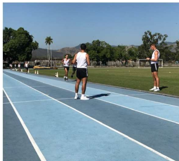
Treinamentos aplicados após a avaliação inicial: Treinamento intervalado.

Após o treinamento os diversos militares serão reavaliados e os resultados obtidos servirão de parâmetros para a atualização do novo manual.