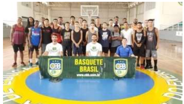
Seletivas cariocas de Basquete 3X3, sediado pela EsEFEx.