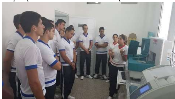
Aula prática da disciplina de Bioquímica no Laboratório de Análises Clínicas IPCFEx,

No dia 27 de fevereiro foi ministrada uma aula prática no Laboratório de Análises Clínicas do IPCFEx, como parte da disciplina de Bioquímica do Curso de Instrutor de Educação Física da Escola de Educação Física do Exército (EsEFEx). Os alunos tiveram a oportunidade de reforçar conhecimentos teóricos aprendidos em sala de aula, aprender sobre metodologias laboratoriais, marcadores utilizados em pesquisas envolvendo saúde e operacionalidade.