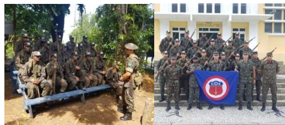
Instrução de Sobrevivência (à esquerda) e foto oficial por término do Estágio Básico (à direita)

Durante o estágio, os 34 militares atletas das modalidades boxe, esgrima, futebol, maratona aquática, natação, orientação, pentatlo militar, triatlo, vôlei de praia e voleibol participarão de instruções com o objetivo principal de promover a adaptação à vida militar.