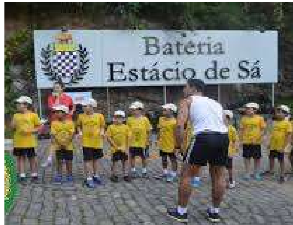
Crianças participando das atividades da Colônia de Férias de 2019.

Grata foi a satisfação de ver esses pequenos “colonins” correndo, brincando e divertindo-se em mais uma Colônia de Férias da Escola de Educação Física do Exército, quartel de nosso Exército Brasileiro, onde estimula-se o gosto pela atividade física, espírito desportivo, noções de civismo. Em breve estarão abertas as inscrições para a Colônia de Férias 2020.