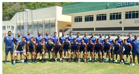
Atletas da seleção militar de futebol. B – Testes na plataforma de salto.