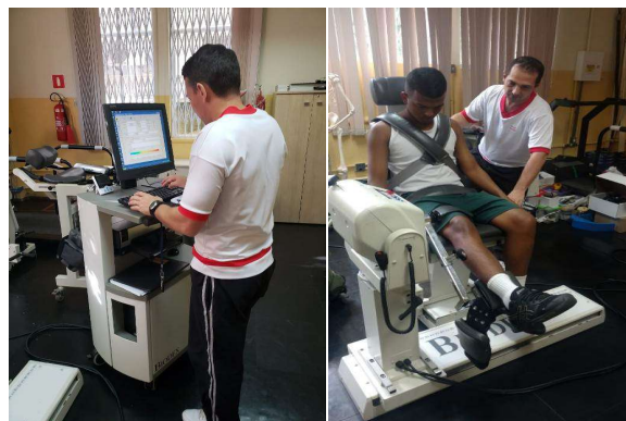
Avaliação do desequilíbrio muscular – equipamento isocinético Biodex.

O IPCFEx realiza estudos em parceria com outras unidades militares e, neste ano, conduziu uma pesquisa com a Escola de Educação Física do Exército (EsEFEx). Militares do 1º Batalhão de Polícia do Exército participaram do estudo, que teve duração de nove semanas e avaliou os efeitos do treinamento de força sobre parâmetros sanguíneos, hemodinâmicos, de composição corporal, força e potência muscular de membros inferiores. Este trabalho teve por objetivo dar suporte à atualização do manual de TFM EB20-MC-10.350.