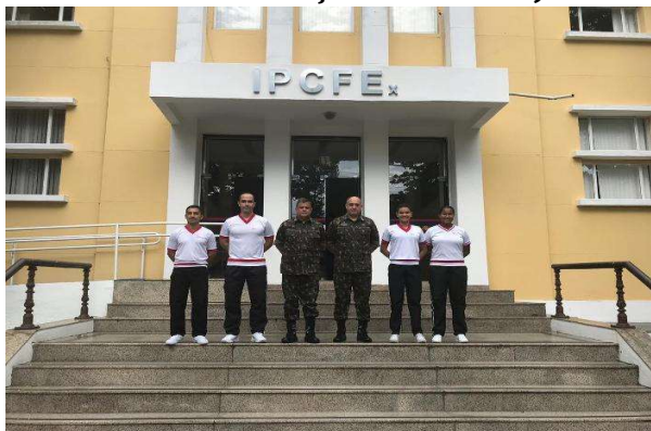
Militares, selecionados para MPCI, avaliados pela equipe de pesquisadores do IPCFEx.