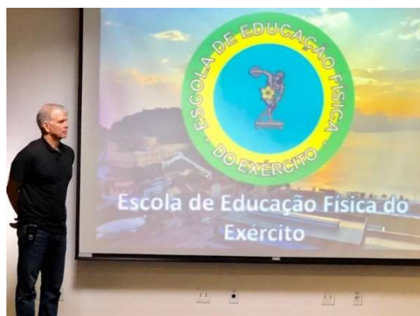
Palestra do Sr. Bernardo Rocha de Rezende “Bernardinho”

No decorrer da palestra, destacaram-se as palavras como “foco”, “preparação”, “trabalho em equipe”, “disciplina”, “perseverança”, “comprometimento”, lições que foram aprendidas nos mundiais e nos jogos olímpicos, durante a sua carreira e, principalmente, como técnico da Seleção Brasileira de Voleibol.