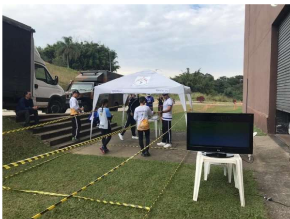
Jogos da Amizade realizados na Academia Militar das Agulhas Negras, na cidade de Resende-RJ.

Estes jovens alunos puderam competir nas várias modalidades como orientação, atletismo, natação, basquete entre outras. Nesse contexto, a EsEFEx, com o seu corpo permanente e os alunos do Curso de Instrutor realizou com profissionalismo, imparcialidade e dedicação toda a arbitragem da