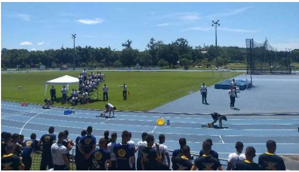
LXVIII Edição das Olimpíadas Acadêmicas, na AMAN.