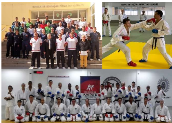
I Simpósio de Karatê do Exército, sediado na EsEFEx.

De 24 a 28 de junho, a EsEFEx sediou o I Simpósio de Karatê do Exército. Participaram do evento representantes de todos os Comandos Militares de Área praticantes de Karatê. Além de ajudar a fomentar este esporte, na vertente do corpo de Tropa do desporto militar, o evento teve por finalidade contribuir na preparação das equipes de Karatê dos diversos Comandos Militares de Área para os Jogos Desportivos do Exército (JDE) 2020.