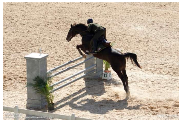
Campeonato de Salto do Exército e o Campeonato Internacional de Cadetes – 2019, Academia Militar das Agulhas Negras (AMAN).

A par dos expressivos resultados obtidos no Campeonato, a competição foi marcada pela participação de todos os círculos hierárquicos. Oficiais-generais, oficiais e praças competiram juntos em todas as provas, fortalecendo a coesão e a integração do Exército Brasileiro, por meio do desporto.