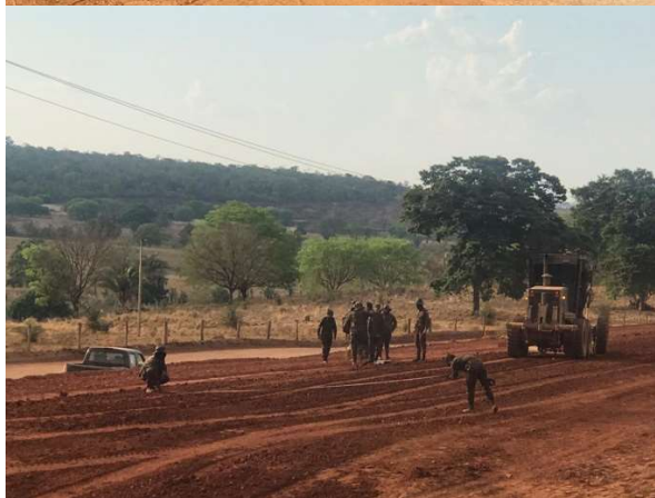
Projeto de Monitoramento do Estado Físico e de Saúde de Militares de Batalhões de Engenharia de Construção do Exército Brasileiro.

Após a fase diagnóstica será realizado um plano de intervenção composto pelo treinamento de habilidades psicológicas, como estratégias de enfrentamento, treinamento físico militar adaptado e direcionado a rotina do destacamento, adequações nos cardápios destes locais, orientações e estratégias nutricionais para controle de sobrepeso, obesidade e