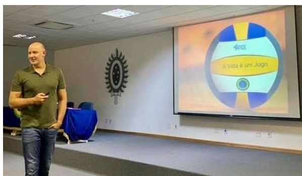
Palestra realizada pelo jogador de vôlei Tande.

No dia 17 de junho, o Corpo docente e discente da EsEFEx assistiu palestra ministrada pelo grande ídolo do vôlei, o Sr. Alexandre Ramos Samuel, o Tande , um dos nomes mais expressivos na modalidade de voleibol, com o tema “A Vida é um jogo”, a apresentação aclamou de forma alegre as semelhanças e aprendizados da vida nas quadras e a vida profissional.