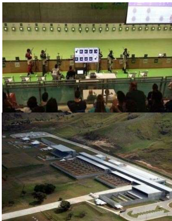
Centro Militar de Tiro Esportivo (CMTE) – Tenente Guilherme Paraense.

Paralimpíadas Rio 2016, Seletiva World Cup Munique e Gabala, Seletiva Ibero Americano, Sul-Americano, Mundial Júnior, II Copa Sul-Americana, etapas e finais dos Campeonatos Brasileiros, Copa do Mundo de Tiro Esportivo-2019, entre outros.