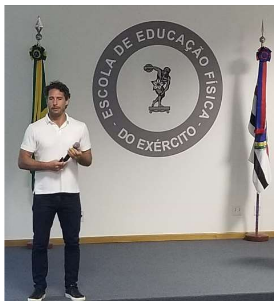
Palestra ministrada pelo judoca Flávio Canto.

No dia 22 de maio, os corpos docentes e discente da EsEFEx tiveram a oportunidade de ouvir um dos grandes nomes do judô mundial, Flávio Canto . Na