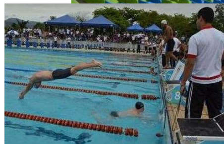
Centro de Treinamento de Pentatlo Moderno Coronel Eric Tinoco Marques.