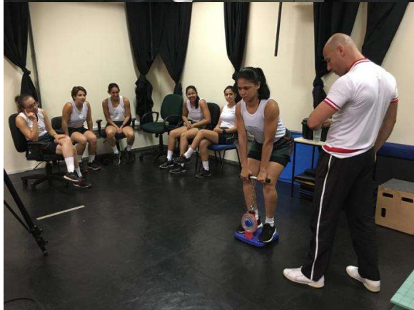
Militares da Linha de Endino Militar Bélico (LEMB) em avaliação pelo IPCFEx: execução da atividade física, aferição da pressão arterial, avaliação da composição corporal – DEXA, avaliação de força dos membros inferiores.