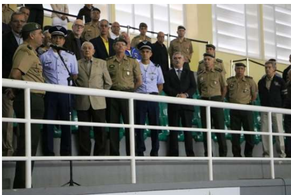
Abertura do Campeonato de Basquetebol do Exército 2019.

acumulou o título de campeão no sul-americano individual de lances-livres, na Colômbia.