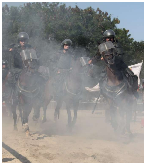
Estágio básico de emprego militar de equídeos – 2019.