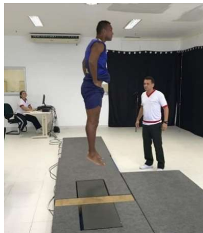
Atletas da seleção militar de futebol: testes na plataforma de salto.

Entre os dias 25 e 29 de março, os atletas da seleção militar de futebol realizaram os Testes na Plataforma de Saltos, no Laboratório de Pesquisas da Escola de Educação Física do Exército (EsEFEx), visando à preparação para os 7º Jogos Mundiais Militares.