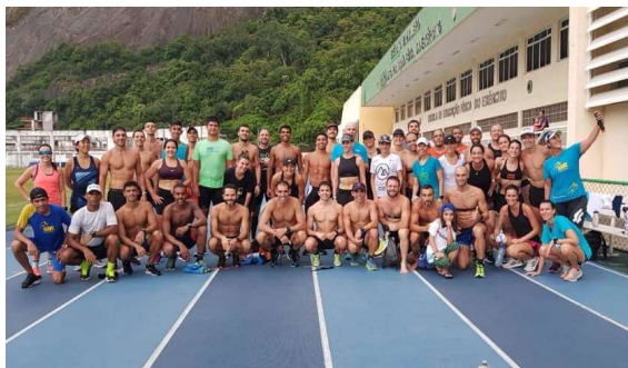
1º Training Camp 021 de Triathlon, reuniu 60 atletas de Triathlon, treinadores e profissionais de saúde se nas instalações da EsEFEx.