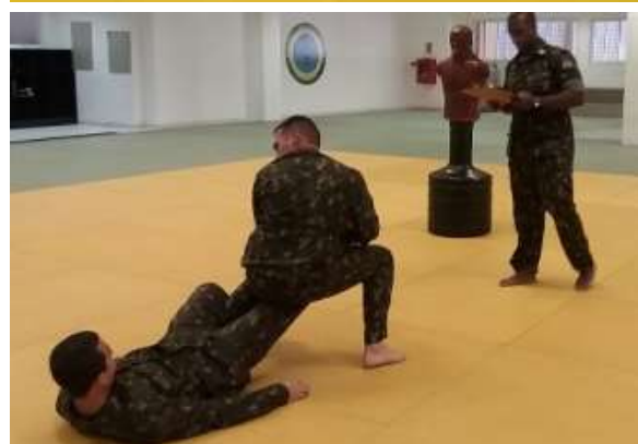
Estágio Setorial de Combate Corpo a Corpo