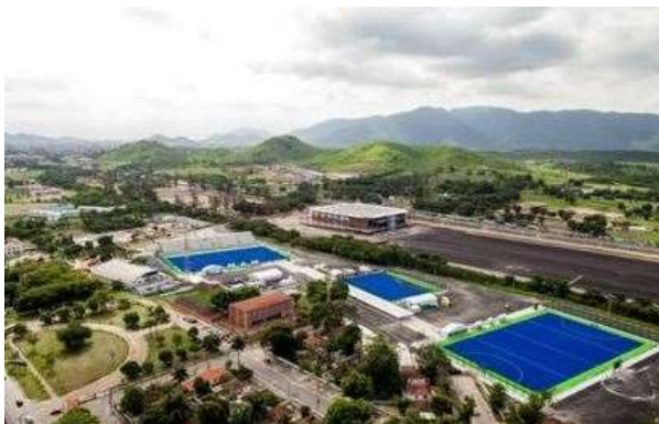
Centro de Treinamento de Hóquei sobre Grama Sargento João Carlos de Oliveira.