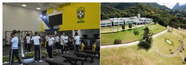
Visita dos alunos do Curso de Instrutor de Educação Física à Granja Comary, Teresópolis - RJ.

No dia 10 de setembro, o Curso de Instrutor de Educação Física realizou uma visita às dependências do Centro de Treinamento da Seleção Brasileira de Futebol, na Granja Comary em Teresópolis-RJ. Na oportunidade, os alunos puderam conhecer a excelência da estrutura que é oferecida aos atletas das categorias de base e seleção principal.