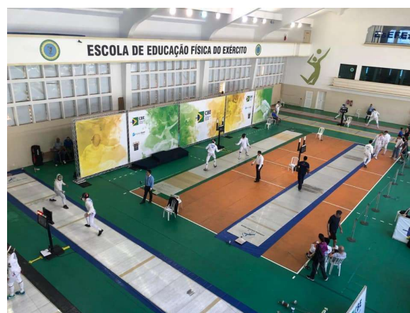
2º Torneio Nacional de Esgrima.

De 25 a 28 de abril, a EsEFEx sediou o 2º Torneio Nacional de Esgrima. Nesta atividade, os alunos do Curso de Mestre D'Armas 2019 tiveram a oportunidade de aplicar os conhecimentos teóricos e práticos adquiridos até o momento, tais como a organização e a arbitragem de competições de esgrima de nível nacional.